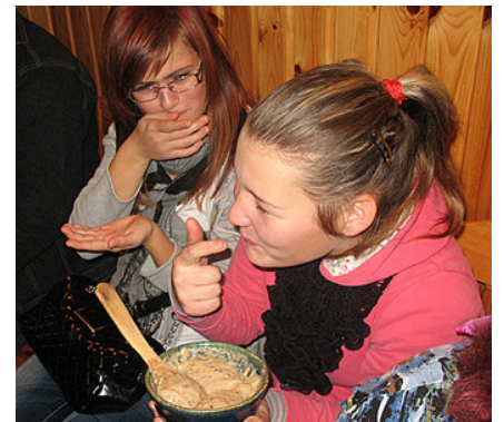
Tā garšo labi!