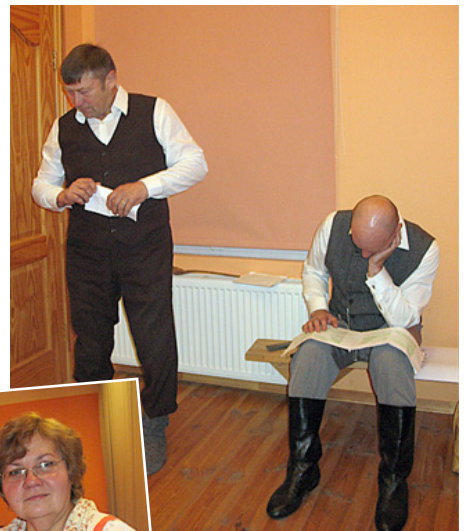
Galvenais, lai nesajauktu vārdus!