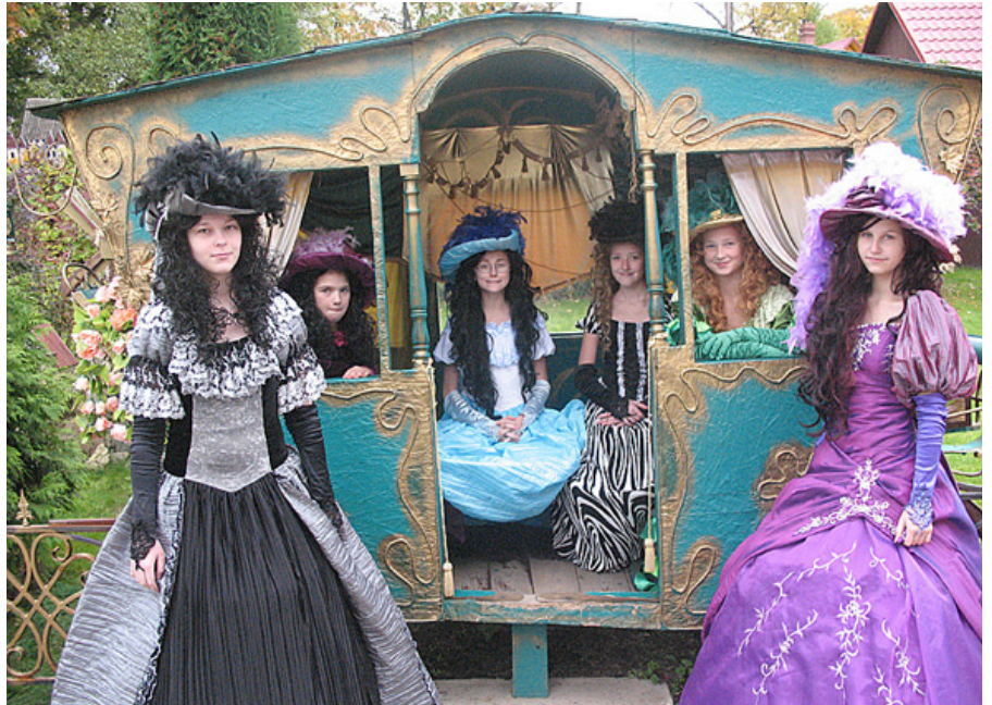
Skaistās princeses un karalienes!