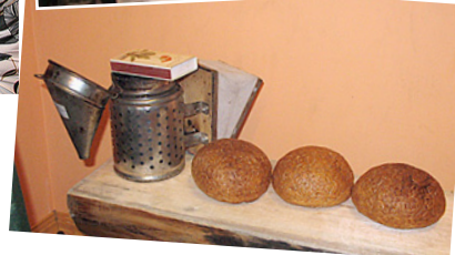
Viss sagatavots maizes cepšanai.