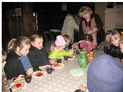
Cienājamies ar gardām pankūkām.

šeit savu mūža lielāko daļu. „Braki” kļūst par viņa daiļrades darbnīcu un mājām. „Te ir varen jauki, un te es arī vislabāk varu rakstīt,” atzinis pats rakstnieks.