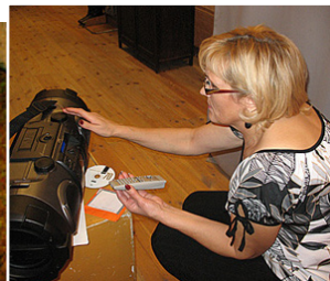
Mūzika skan. Un izrāde var sākties.