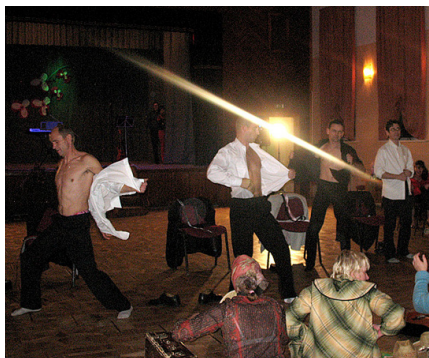
Uzstājas Degumnieku tautas nama dramatiskā kolektīva puīši.