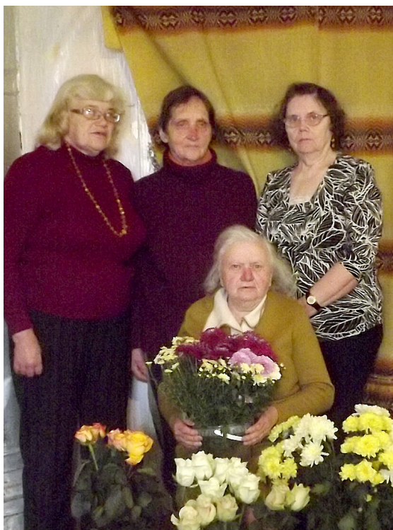
Jubilāre kopā ar draudzenēm.