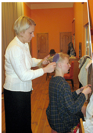
Matiņiem jābūt kārtībā...