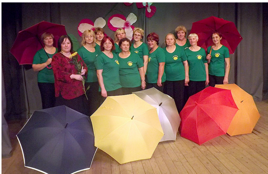
„Saulgriezes” pēc koncerta.