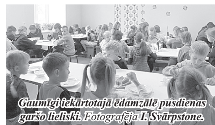
Gaumīgi iekārtotajā ēdamzālē pusdienas garšo lieliski.

Saimnieces iztaujāja un informāciju sakārtoja Līna Nagle 8. kl.