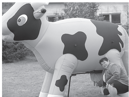
Līga izrādījās prasmīga slaucēja.

Mašīnas vilkšanā un riepās velšanā savus spēkus izmēģināt devās igauņu vīrieši. Līdztekus norisinājās golfa turnīrs bērniem. Izbrīnīja un iepriecināja igauņu bērnu uzvedība. Viņi netaisījās vecākiem pa kājām, neblaustījās, nepieprasīja vecāku uzmanību sev. Šeit bija radīta iespēja ka-