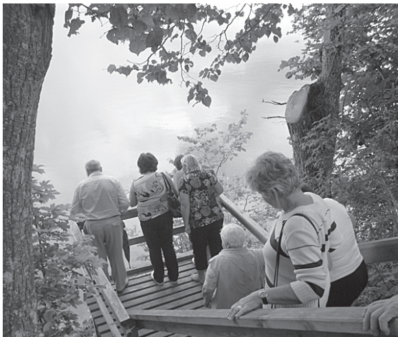
Vietā kur nogrimis Staburags.