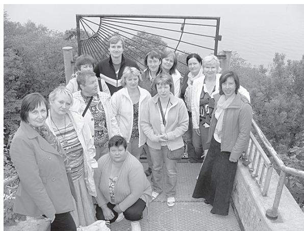
Kopā ar ”Maadam” dalībniecēm pie Valastes ūdenskrituma.

Ievērojamākais apskates objekts – Narvas cietoksnis – sagaidīja ar lielgabalu zalvē, jo šeit tika izspēlētas Ziemeļu kara (1700-1721) kauju ainas. Karadarbība vēl nebija sākusies, notika vien lielgabalu iesildīšana. Iekšpagalmā darbojās amatnieki, tirgotāji.