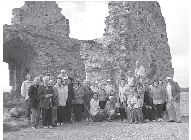
Kopbilde Kokneses pilsdrupās.