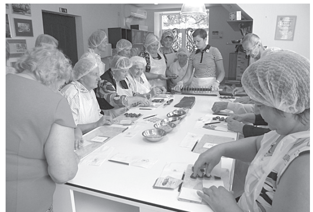
Darbošanās “Saldumu darbnīcā”.