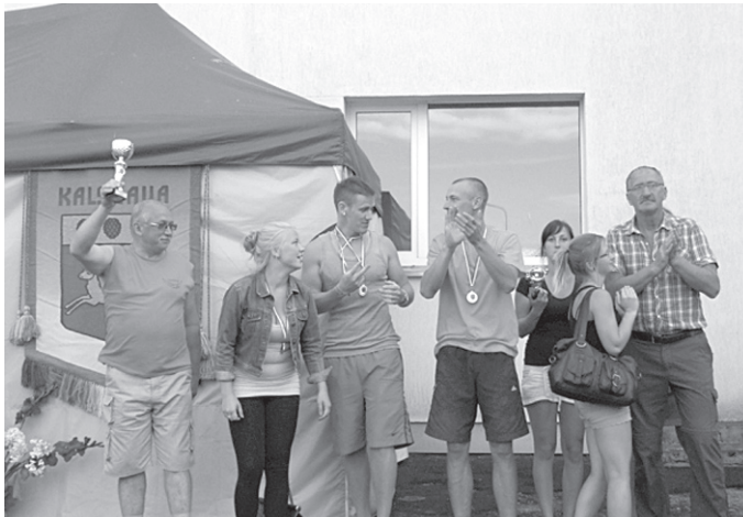
Sarkaņu pagasta komanda ar iegūto balvu.