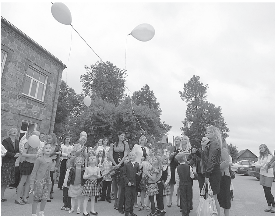
Pirmās skolas dienas vēlējumus un papildīšanās cerību augstu debesīs aiznes baloni.