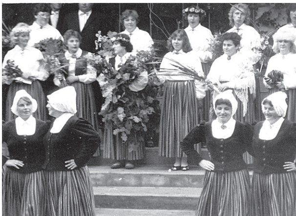
Mirkļis no kolhoza 40 gadu jubilejas koncerta 1989. gadā.

Tad nāca kolhozu laiks, dzīve Sarkaņos, tāpat kā visā Latvijā, izmainījās pašos pamatos. Mūsu pagasta ļaudis arī jaunajos apstākļos prata saglabāt svētku tradīcijas un svētku prieks nepazuda. Mūsu ģimene dzīvoja un strādāja kolhozā „Rītausma” kopš 1948. gada rudens. Vēlāk, kad apvienojās kolhozi „Rītausma” un „Jaunais ceļš”, izveidojās kolhozs „Jaunais rīts”. Uz laiku bija pieklusuši Jāņi un līgošana, reti iedegās Jāņu uguns kuri, bet domās vēl pelnos gailēja ogļītes, kas it kā gaidīja uzpūšam liesmu. Un viss pamazām