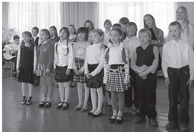
Bērni dzied un muzicē saviem tuvākajiem – vecākiem.