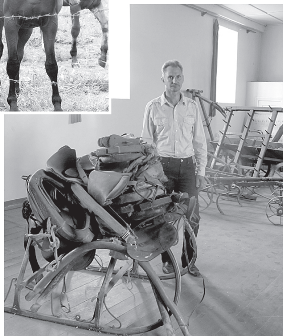
Andra iekārtotās izstādes Aizkujas klubā.