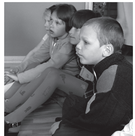
Teātra dienā pirmklasnieki dzīvespriecīgi spēlēja ludiņu „Rausis”.