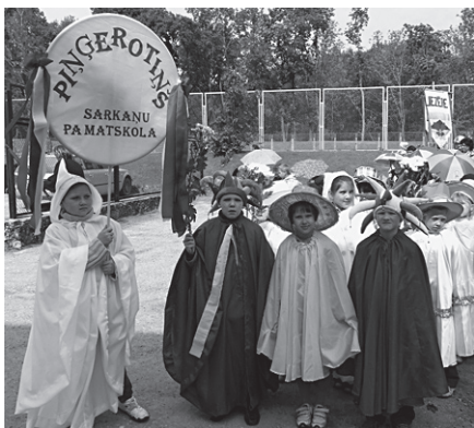
„Piņģerotiņa” aktieri pirmssvētku atklāšanas gājiena.

1. jūnijā aktīvas darbošanās diena, gan pašiem spēlējot, gan citu rādītos teātrus skatoties, bija skolas teātrim “Piņģerotiņš”. Krāsaini un teātra pasākumam atbilstoši, pateicoties teātra vadītājas Guntas Apeles rūpēm, mūsu mazie aktieri gāja novada Teātra dienas pasākuma “Ceļā pēc brīnumput-