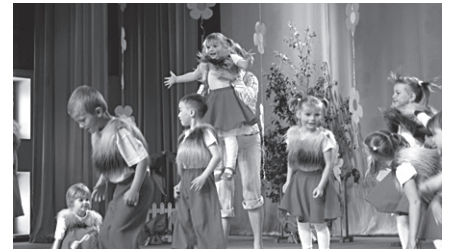
Dzīvespriecīgas un krāsainas danco mūsu „pelītes” uz lielās kultūras nama skatuves Madonā.

Pēdējā skolas dienā, 31. maijā, bērnu darza grupiņa devās uz Madonas kultūras namu, lai uzstātos muzikālajā pasākumā “Jampadracis pavasara pļaviņā”, kurā piedalījās sešu bērnu darzu un piecu pirmsskolas grupu audzēkņi, rādot savas prasmes gan dziedāšanā, gan dejošanā. Uzvedums bija interesants, jo bērni iejutās pļavā, mežā un mājās mītošo dzīvnieku tēlos.