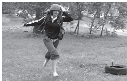
... bet Laila Kaspāre trasi veic ar spēku.