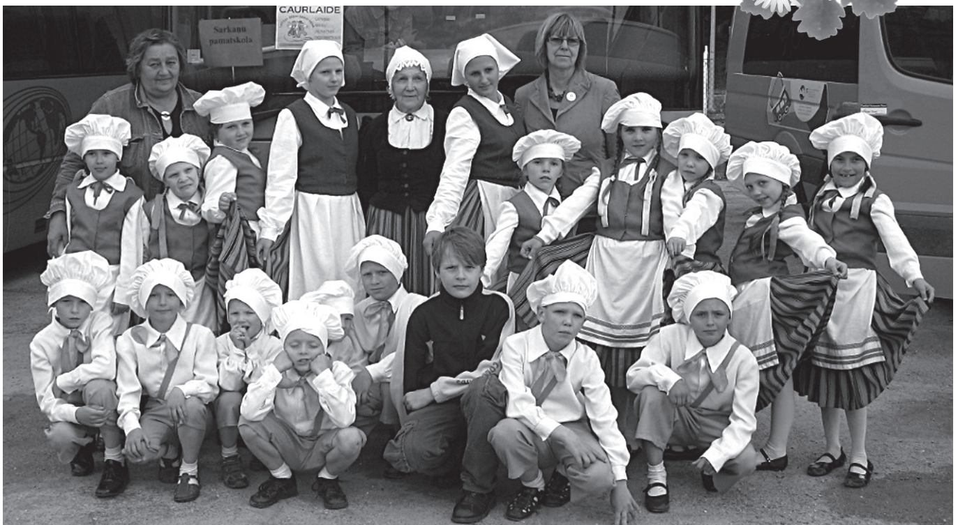
Visi kopā, gaidot uzstāšanos – pirms Madonas novada programmas.

Sper, pārkon, kad sperdāms, Nesper Jāņu-vakarā; Tev pieder viss gadiņš, Man tas Jāņu vakariņš.