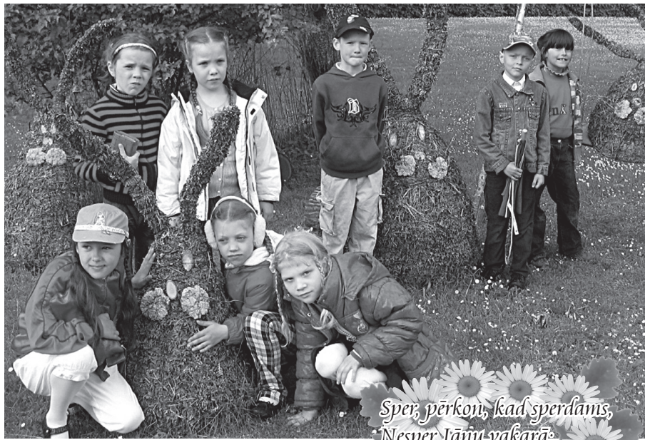
Visa pirmā klase ekskursijas laikā pa Gulbeni vēl pirms dancošanas.

Sper, pārkon, kad sperdāms, Nesper Jāņu-vakarā; Tev pieder viss gadiņš, Man tas Jāņu vakariņš.