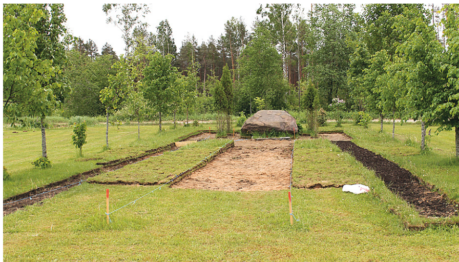
Uzsākta projekta realizācija.