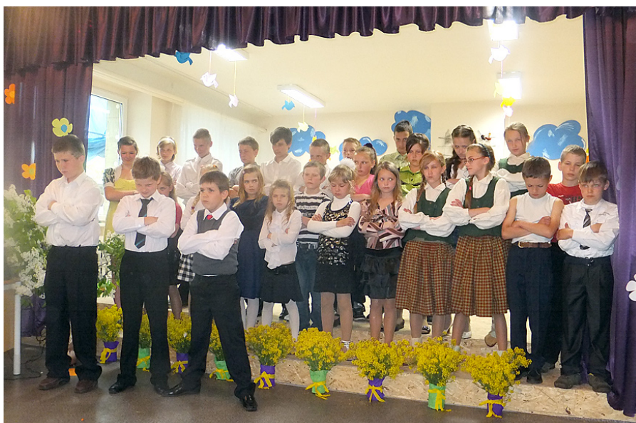
Skolas dziedošie bērni iejūtošies bargā skolas direktora lomā.