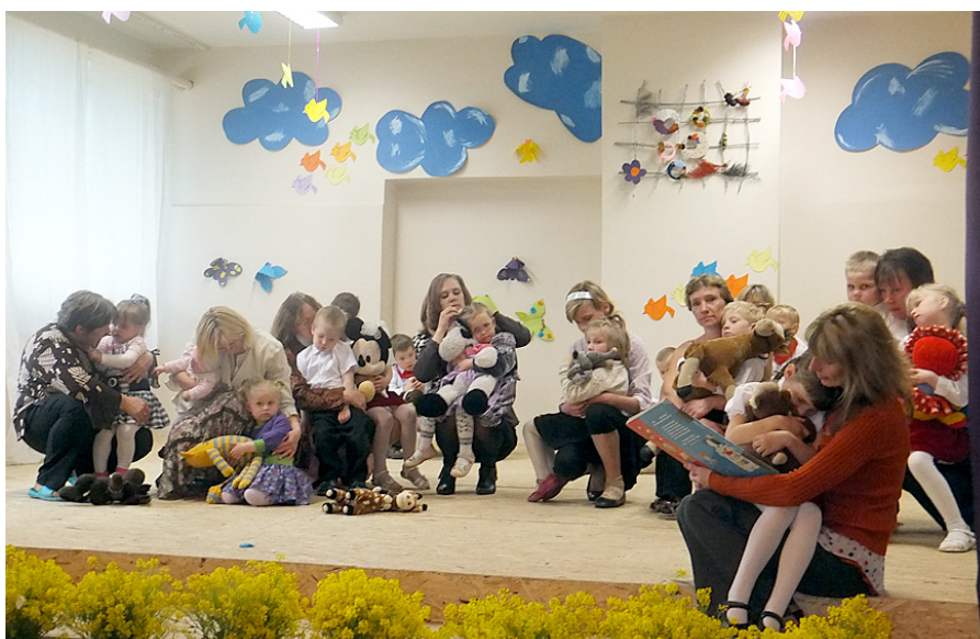
Sirsnīgs un ļoti emocionāls bija pirmsskolas bērnu mammu iznāciens uz skatuves, vienojoties kopīgā mīlestības apgārtā mirklī.