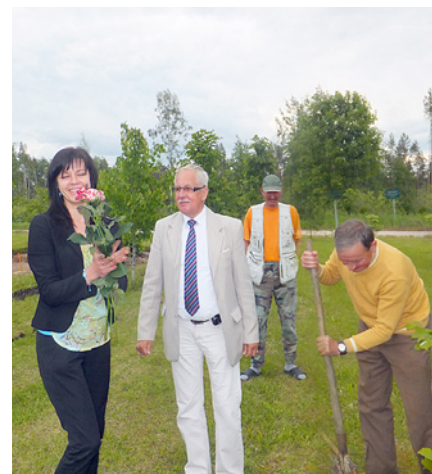
Paldies Aritai par ieguldīto darbu.