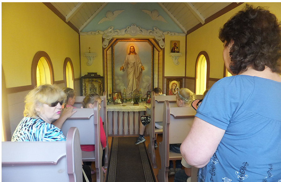
Latvijas mazākajā baznīcā.

zināms, kāpēc tam ir tik cēls nosaukums. Iespējams, ir kāda saistība ar Lietuvas karali Mindaugu, kurš šajā apkārtnē ir it kā nogalēts un apbedīts, bet viņa kapavieta nav zināma. Kad Stupāņu ģimene šeit nopirka divdesmit hektārus zemes un sāka kokiem un krūmiem aizaugušajā kalnā atbrīvot