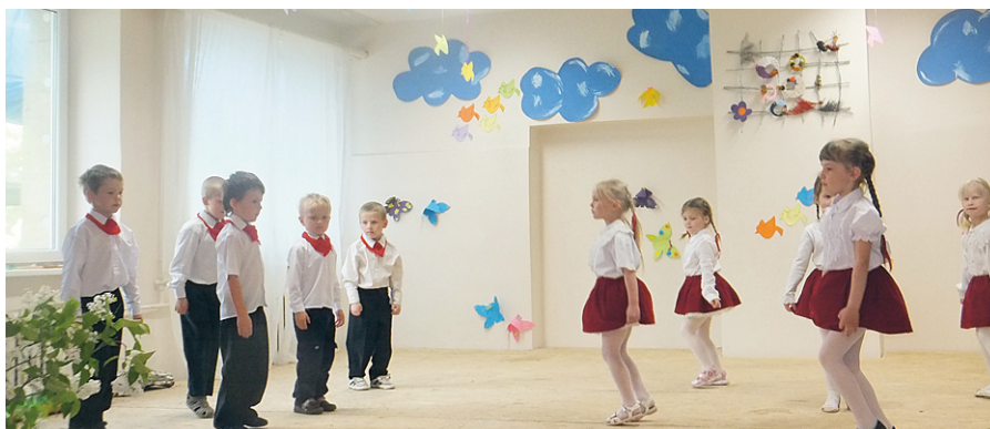
Mākonītis un mākonīte. Dejo pirmsskolas bērni.