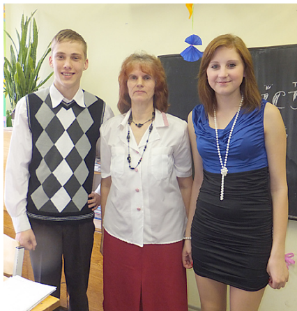
Viens mazs mirklis, kad atkal kopā...