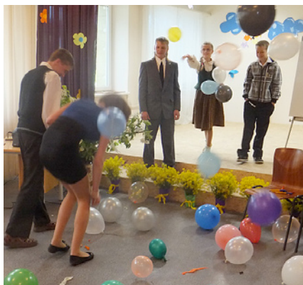
Uzdevums – balonos ir veltījumi skolotājām, tikai kā pie tiem tikt...