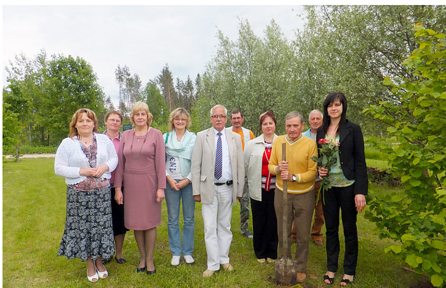
Mētrienas pagasta pārvaldes darbinieki.

patika kinologa nodarbības, arī meikapa veidošana. Iemācījos taisīt telefona maciņus. Patika arī tikšanās ar psihologu. Bet visvairāk atmiņā palikusi nometne Oskara Kalpaka „Liepsalās”. Tur bija daudz interesantu nodarbību. Arī es esmu ieguvusi draugus.