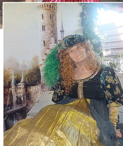
Vai atpazīstat Eleonoru?