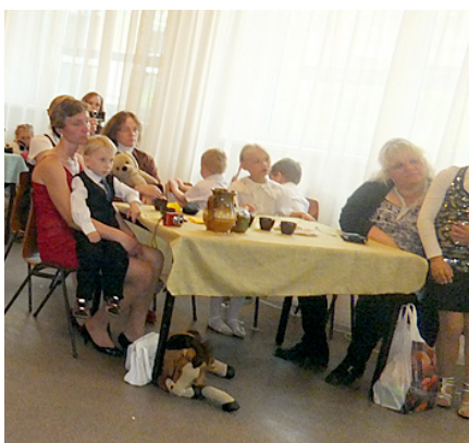
Skatītāju rindās bērnu vismīļākie un vistuvākie cilvēki.