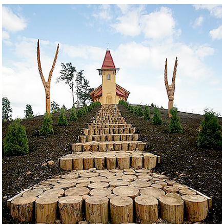
Karaļa kalna baznīciņa.