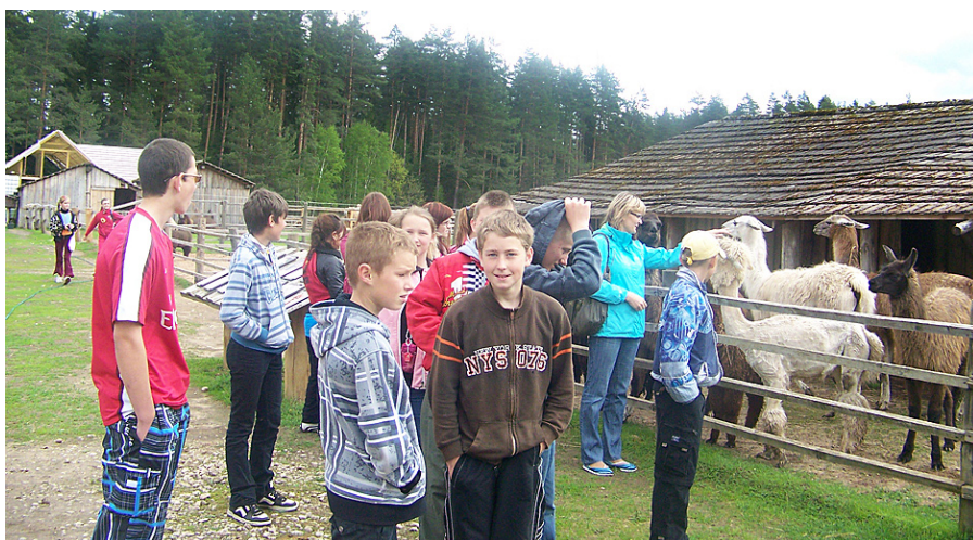
Pie skaistajiem zvēriņiem

Vēl mums tika dota iespēja pabrot šos dzīvniekus, tad vēl pabrukt ar elektromobili,