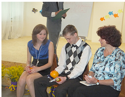
8. klase absolventiem dāvāja vitamīnus.