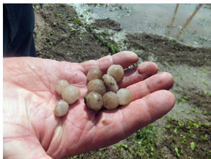
Krusas graudi lielāki par ķiršiem.