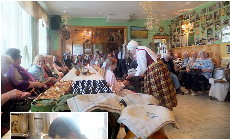
Maizes muzejā tiekam cienāti ar maizīti.