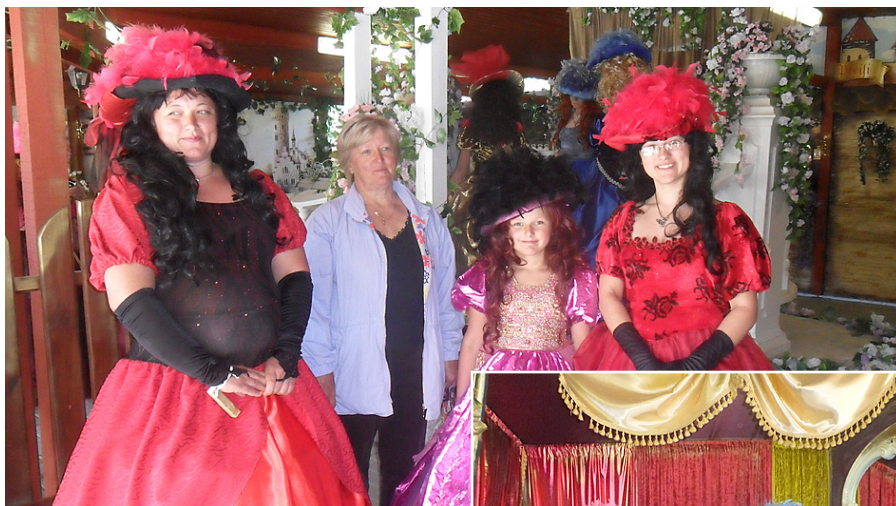
Interesanti iejusties krāšņajos, graciozajos tērpos.