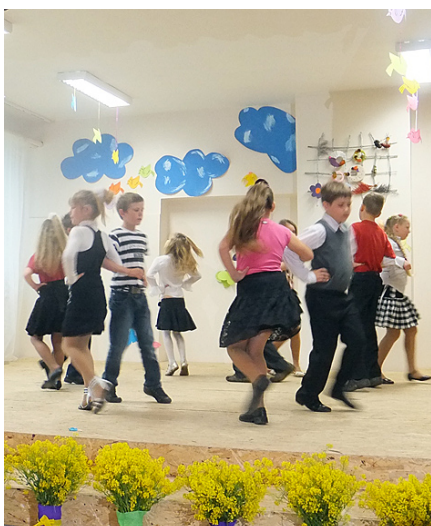
Dejo 2. – 4. klases deju kolektīvs.