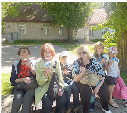
Atpūta Preiļu ieliņās.