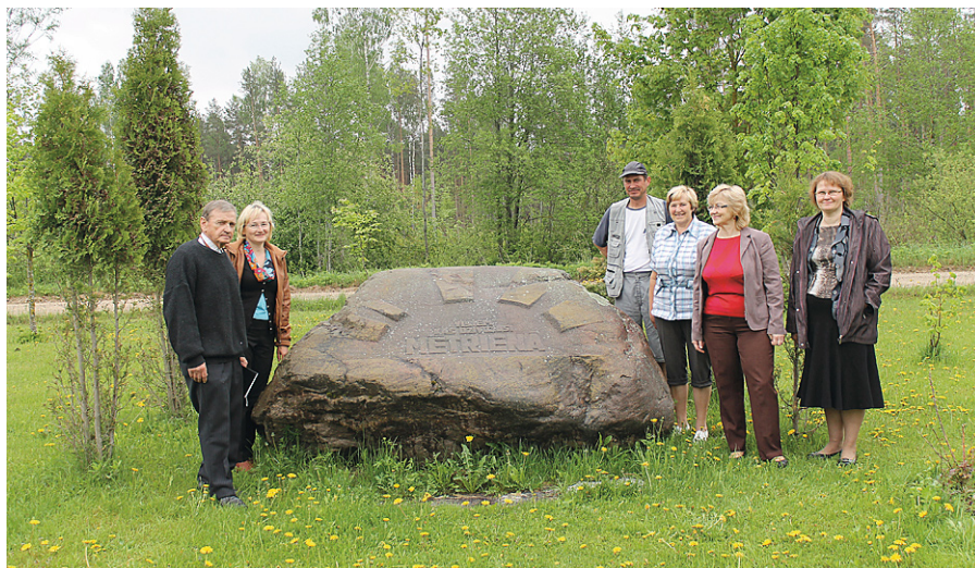
Pirms darbu uzsākšanas.