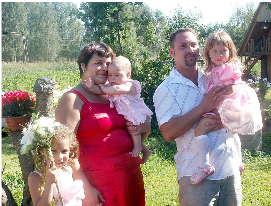
Bārbaļu ģimene svētku brīdī.

Es viņam uzdotu jautājumu: Kad beidzot zemnieki varēs normāli plānot savu dzīvi un saņemt atbilstošu atbildību par savu padarīto darbu?