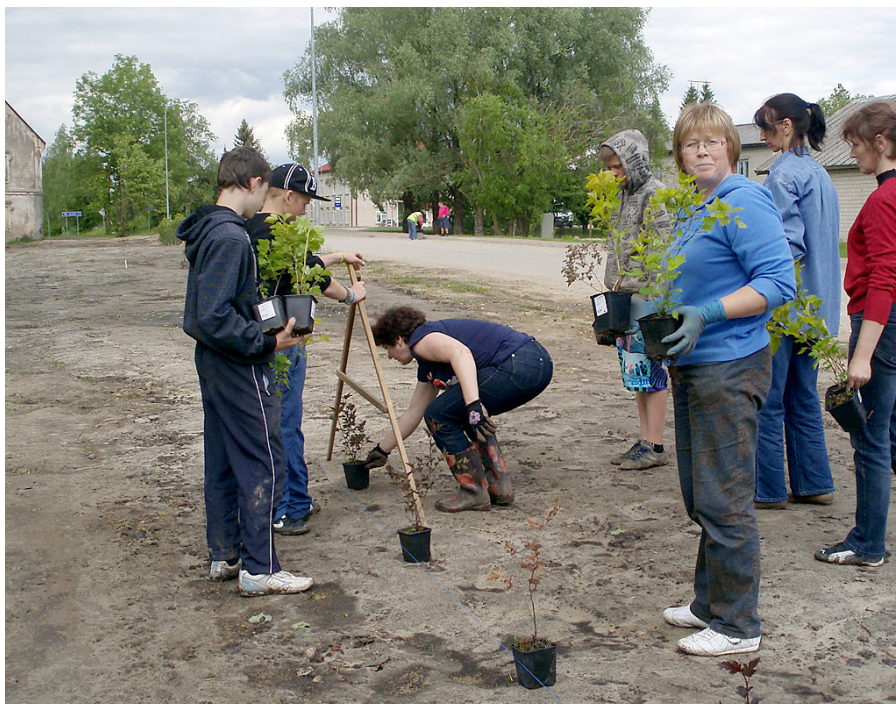
Andas Bicāles padomos ieklausās gan pagasta pārvaldes darbinieki, gan skolēni.

4. jūnijā Ošupes pagasta pārvalde sa- darbībā ar Degumnieku pamatskolu orga- nizēja Degumnieku centra apzaļumošanas talku.