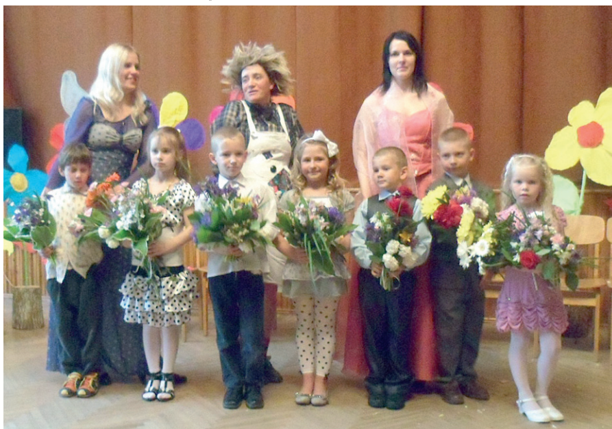
30. maijā izlaidums bija vecākajai bērnudārza grupiņai, nākošajiem skolēniem.