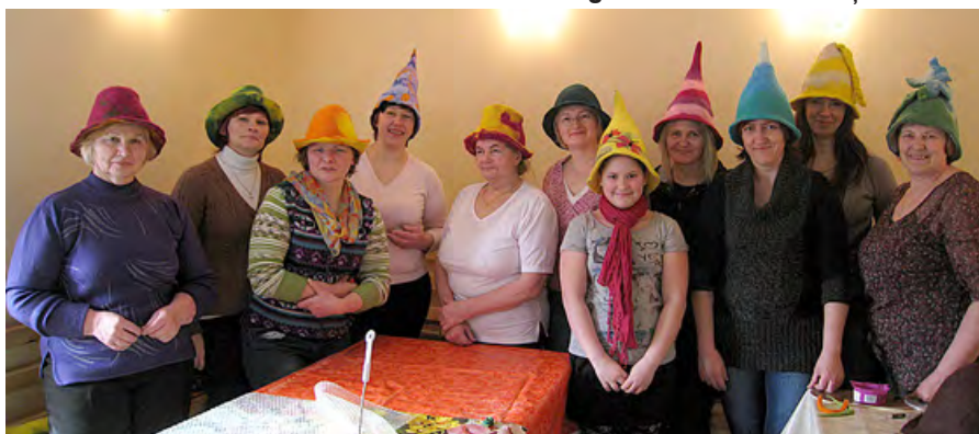
Andas vadītajā nodarbībā ar pašas gatavotām un aizlienētām pirts cepurēm.