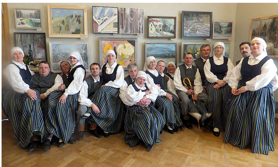
Senioru deju kolektīvs.

25. martā Madonas kultūras namā valdīja saspringta, bet patīkama gaisotne. Norisinājās Madonas deju aprīņka deju kolektīvu skate.