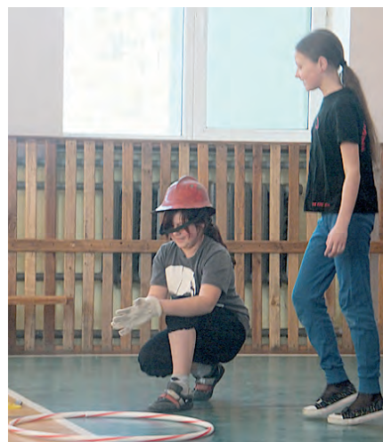
Ātri jāuzvelk cimdi un jādodas ceļā...