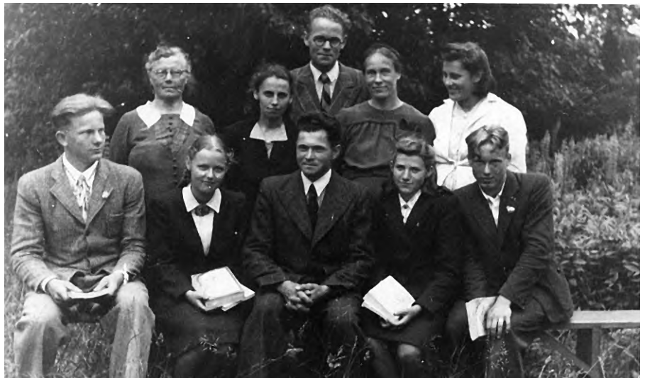
1946. g. absolventi un skolotāji.