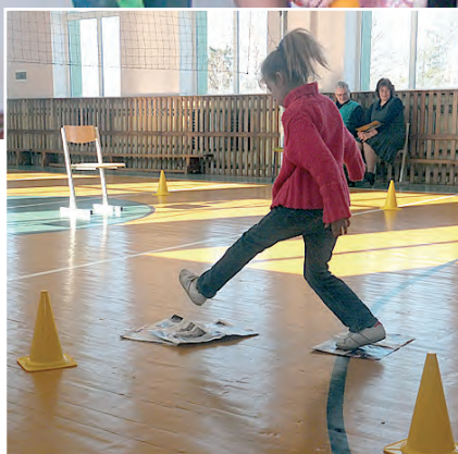
Ātri jāsaliek ceļš no avizēm.