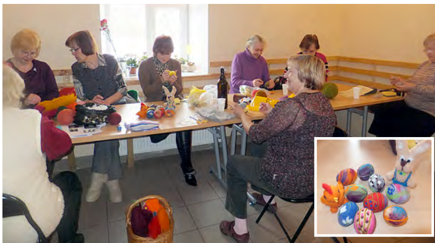
Tiek gatavotas Lieldienu oliņas no filca.