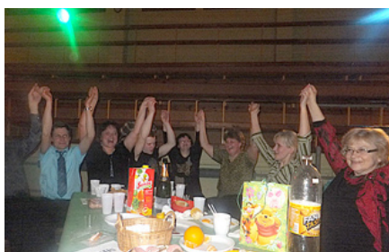
Pasākuma otrā daļa...

Paldies Mētrienas pagasta pārvaldei par finansiālu atbalstu un tautas nama vadītājam par rūpēm un gādību tērpu iegādē.