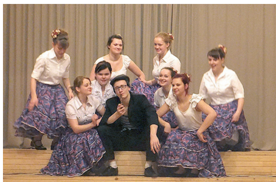
Ļaudonas jauniešu deju kolektīvs.