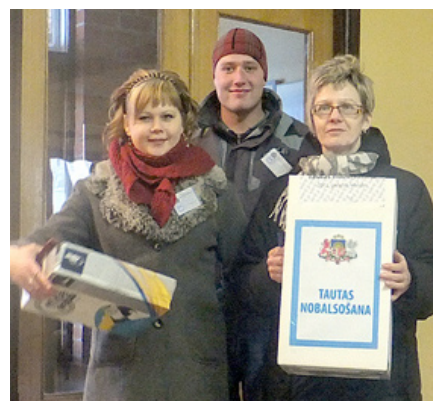
Atrgriešanās no balsošanas balsotāja dzīvesvietā.