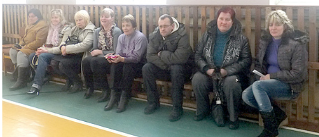
Līdzjūtēju rindās vecāki.