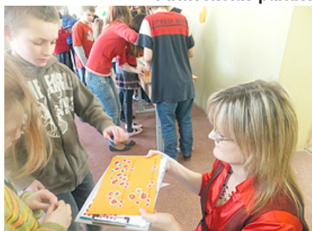
Par savu pāri balso arī skatītāji.