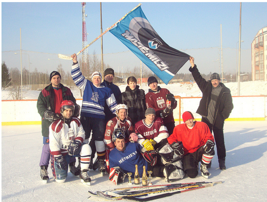
Mētrienas hokeja komanda pēc spēlēm Madonas novada čempionātā.