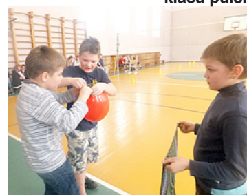
Atri jāpiepūš balons un jādodas stafetē.