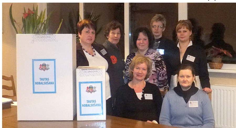
Mētrienas vēlēšanu iecirkņa komisija.