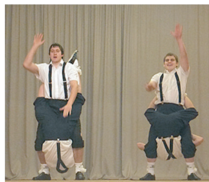
Ošupes pagasta Degumnieku tautas nama puīši.