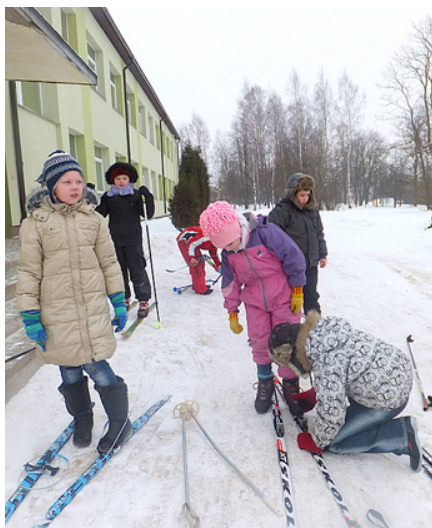
Lielie zēni mazajiem palīdz uzvilkt slēpes.

Kas gan tā būtu par ziemu, ja nevarētu paslēpot? Sporta skolotāja ar Mētrienas pagasta pārvaldes finansiālu atbalstu sporta stundu vajadzībām, iegādājās 14 pārus slēpju. Šajos grūtajos ekonomiskajos apstākļos skolēniem mājās nav pašiem savu slēpju. Vecāki vienkārši tās nevar atļauties iegādāties. Lētākais slēpju pāris ar zābakiem maksā apmēram Ls 70.