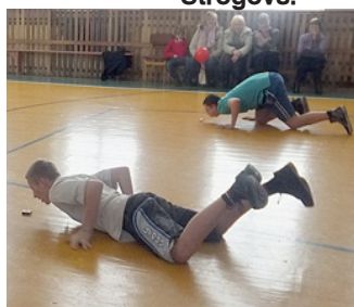
Kurš ātrāk aizpūtīs sērkokociņu kastīti.