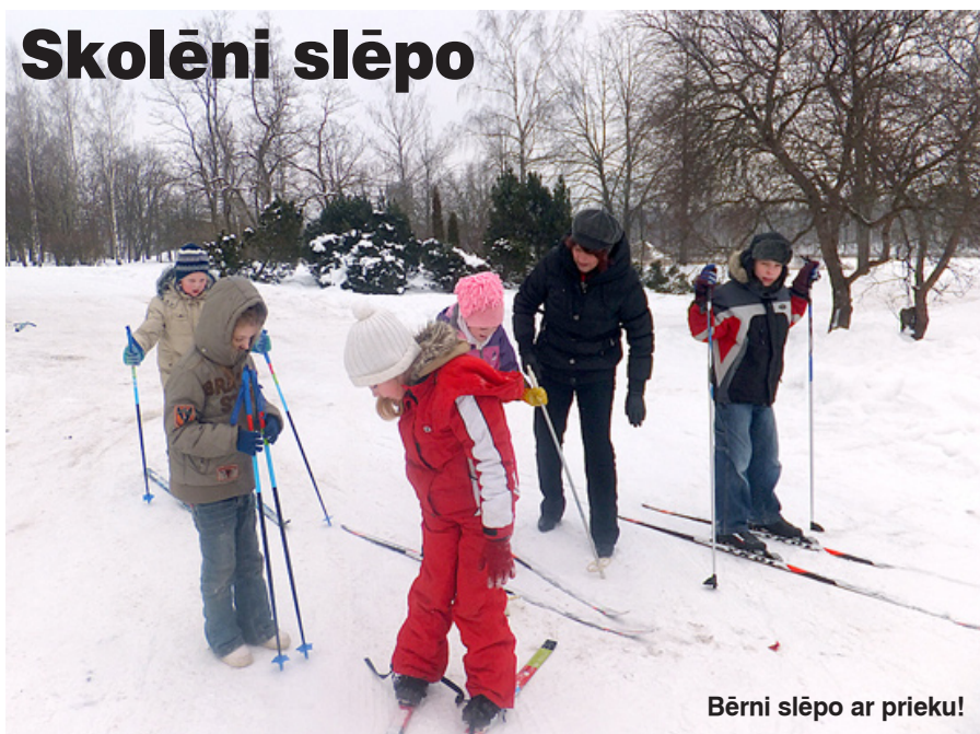
Bērni slēpo ar prieku!