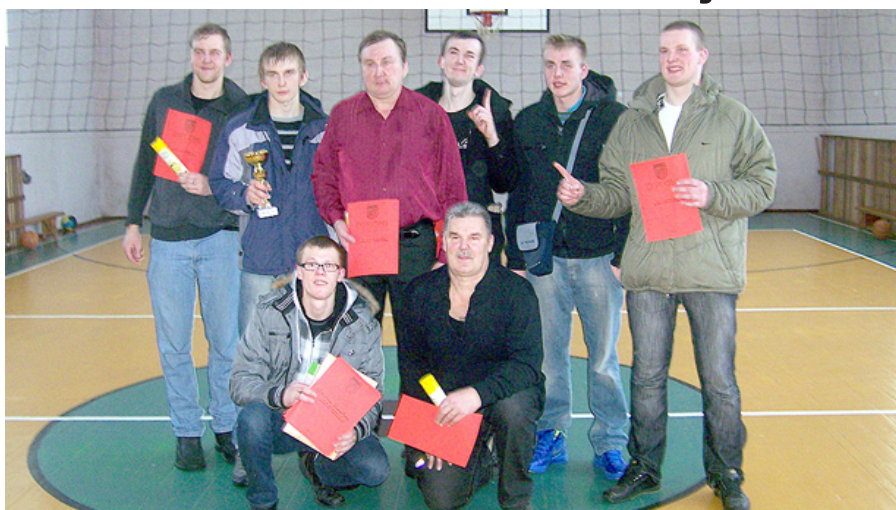
Uzvarētāji – Ramatas vīri.