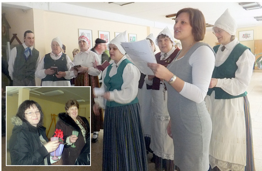
Mūs sagaida ar gardu mājas vīnu...

Koncerts iesākās ar kolektīvu vadītāju valsī. Pēc tam tika izdejošanas visas skates dejas, kā arī katrs kolektīvs sniedza vienas dejas priekšnesumu. Mūsu kolektīvam šī bija pirmā uzstāšanās jaunajos tautas tērpos.