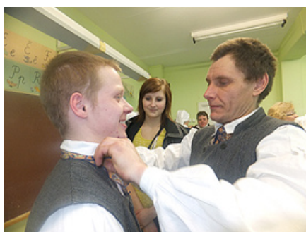
Kā vienmēr noder izpalīdzīga roka.