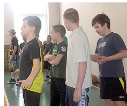
Stafetē dodas skolas vecāko klašu puiši.