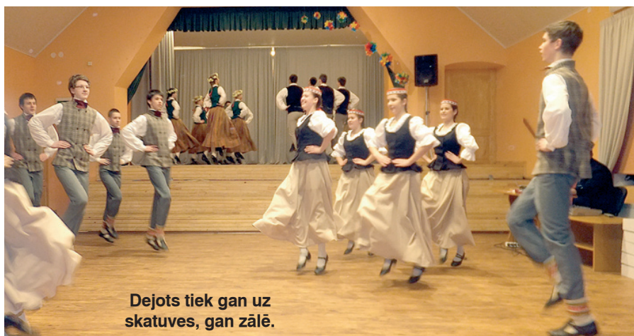
Dejots tiek gan uz skatuves, gan zālē.