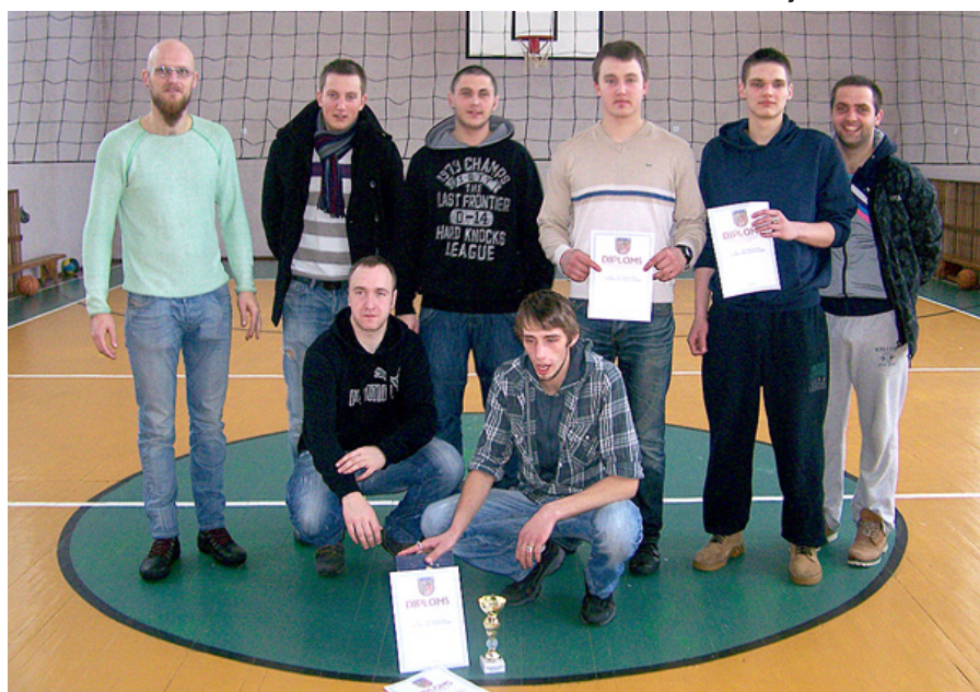
Mētrienas vīriešu volejbola komanda.