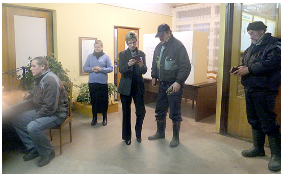
Pirmie vēlētāji Mētrienā.

2012. gada 18. februāra tautas nobalsošana par likumprojekta „Grozījumi Latvijas Republikas Satversmē” pieņemšanu