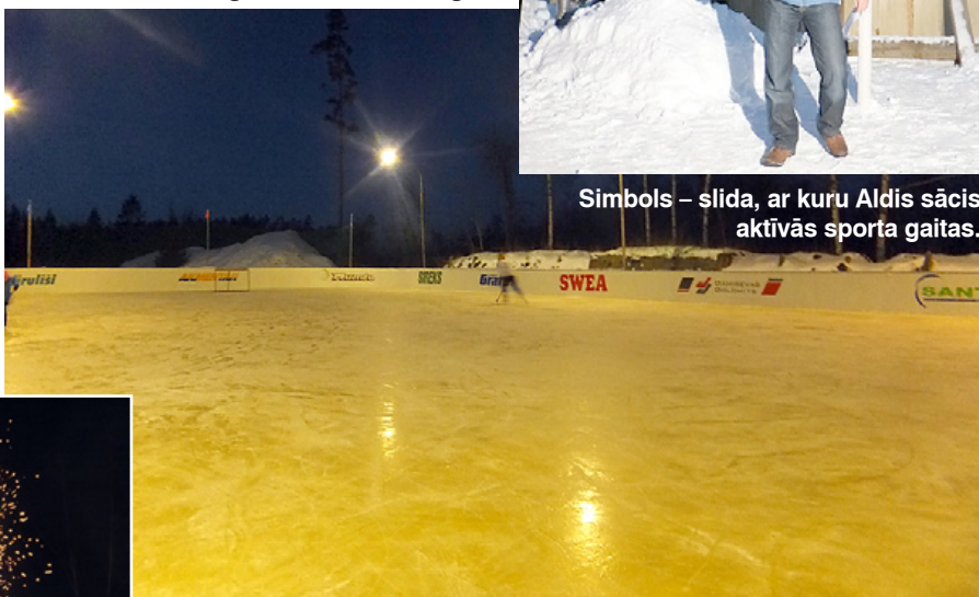
Laukums gatavs cīņām.