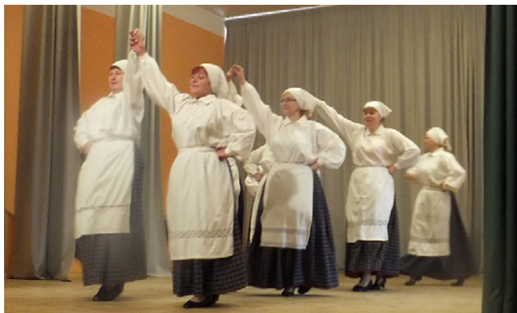
Dejo Mētrienas tautas nama dāmu deju grupa.