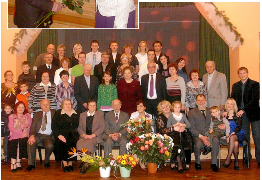
Jubilāre radu, draugu un kolēģu vidū.