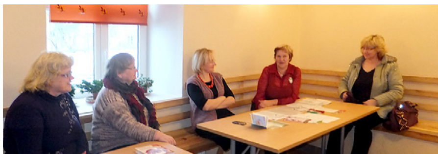
Sieviešu kluba meitenes plāno darbu.