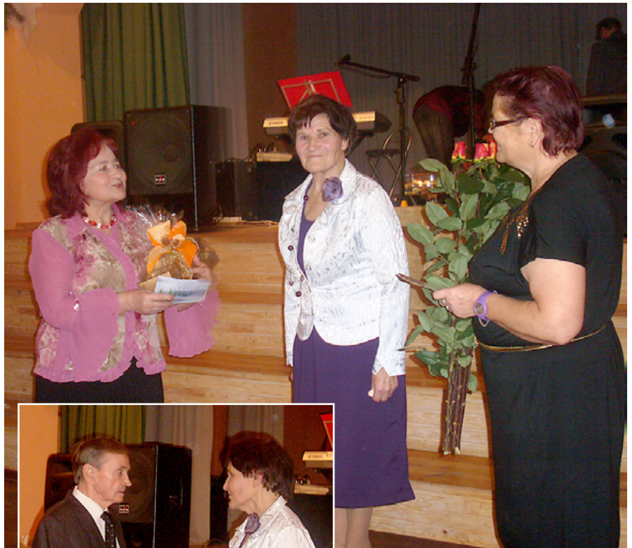
Sveicēju vidū bijušās kolēģes.