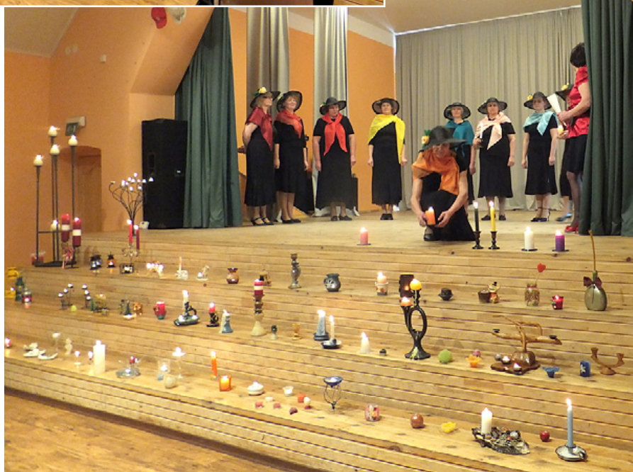
Katras krāsas svece tika iededzināta.

sveces, neviens zālē ienākošais nepalika vienaldzīgs. Skaisti. Romantiski. Silti.