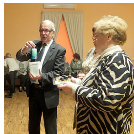
Pagasta pārvaldnieks priecājas par savu krāšņo sveci.