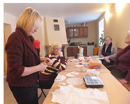
Lilīta rāda, kā pagatavot Lieldienu Zaķi.

tik gardie kartupeļi. Klubiņā gaidīta ikviena sieviete! Nāciet!