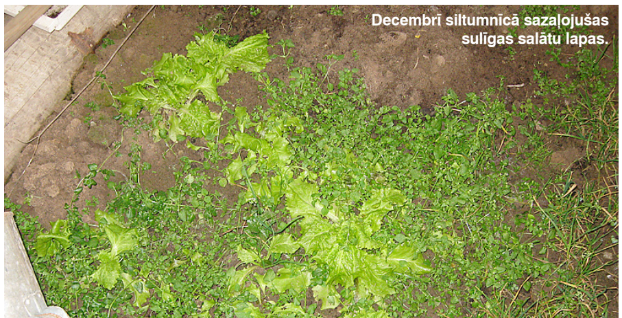
Decembrī siltumnīcā sazaļojušas sulīgas salātu lapas.

Un kādus pārsteigumus daba tev sagādājusi? Uzraksti! Mums būs interesanti to uzzināt!