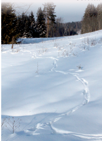
V. Otvares foto