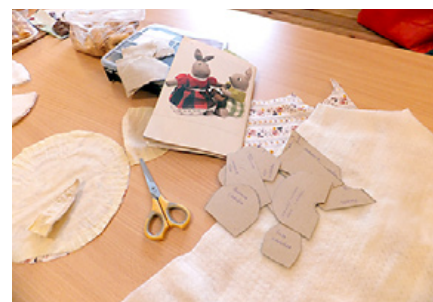
Darbam viss jau sagatavots laikus.

Ieceru ir daudz. Ļoti patikusi desu cepšana, kas liek šo nodarbi turpināt. Tu vājkājā laikā domāts rīkot Kartupeļu balli, kad ikviena saimniece varēs palepoties ar savām receptēm, kurās izmantojami visiem