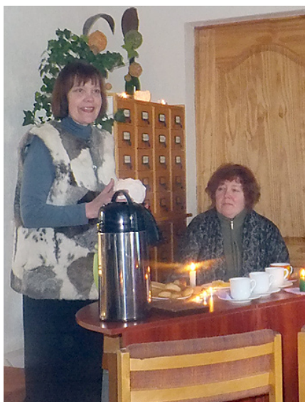
Tradīcija turpinās – svece no rokas rokā.