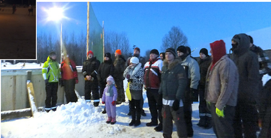
Uz svinīgo laukuma atklāšanu pulcējušies teju sešdesmit interesentu.