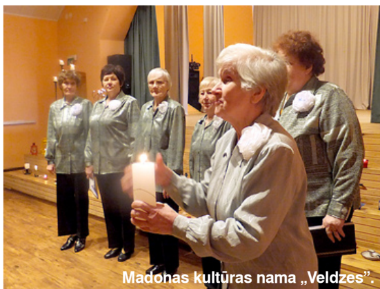
Madonas kultūras nama „Veldzes”.