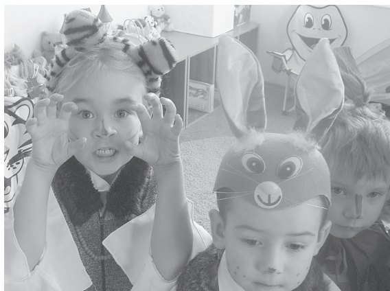
Mārtiņdienai atbilstošās maskās mazās skolas bērni.