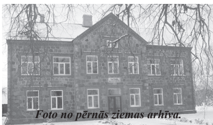
Foto no pērnās ziemas arhīva.