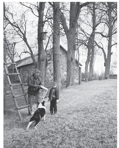
Kopā ar mazdēlu, gatavojot putnu būrus.

Sajūta, atgriežoties dzimtenē, brīnišķīga