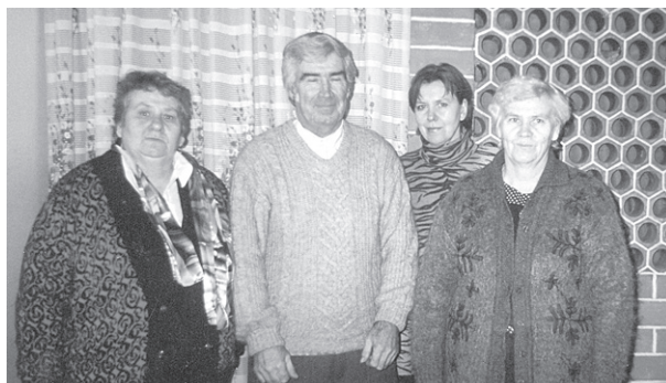
Vēl visi kopā...

Rīgas Pedagoģijas un izglītības vadības augstskolu un darbojas tirdzniecības jomā.