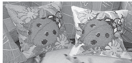
Izšūti spilveni – mājas rota.