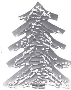
Linarda Veipa līmētā eglīte.