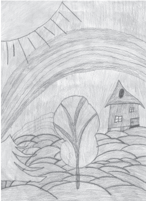
Zīmēja Niks Meščerskis.