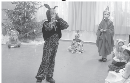
1. klases skolēni spēlēja ludziņu „Slavenais runcis”.

21.12. – ziemas saulgriežos skolā svētki, ko atklāja un vēlējumus teica skolēnu līdzpārvaldes vadītāja Laila. Brīnumsvēcītes iededza labinieki mācībās. Skanēja Ziemassvētku dziesmas un dzejoļi, uzstājās dejojāji, skatījāmies gan leļļu teātra priekšnesumu, gan ludziņu „Slavenais runcis”. Svētku noskaņu bagātināja ģitāristu spēle, saksofona solo un kopīgi dziedātās dziesmas.