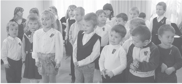
Tautasdziesmas svētkos runā paši mazākie – bērnodārza grupiņa.