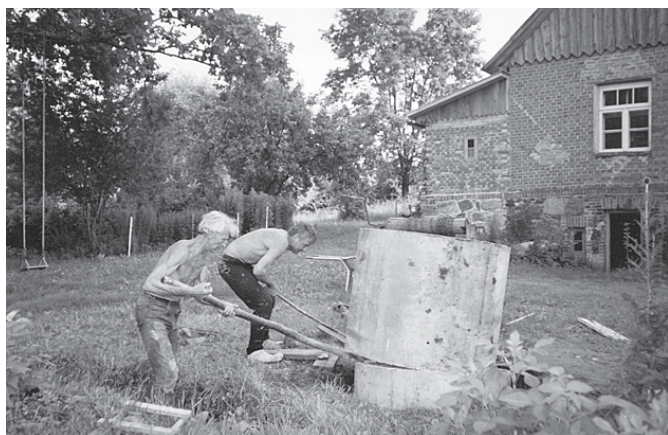
Lauku mājās darbu netrūkst.