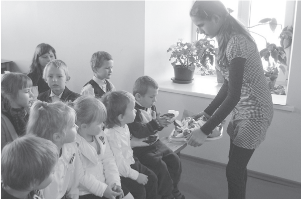
Jau par tradīciju kļuvusi cienāšanās ar svētku klinģeri.