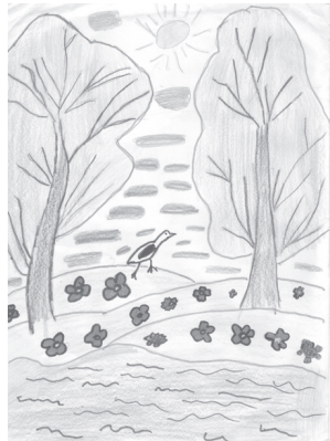
Zīmēja Agija Lazdiņa.

Skolā svētku nedēļa iesākās jauki. 11. novembrī datorklasē varējām vērot skolotājas Ilonas veidoto foto prezentāciju. Iepriekš skolotāja fotografēja vienu dienu abās skolās - mazajā un lielajā.