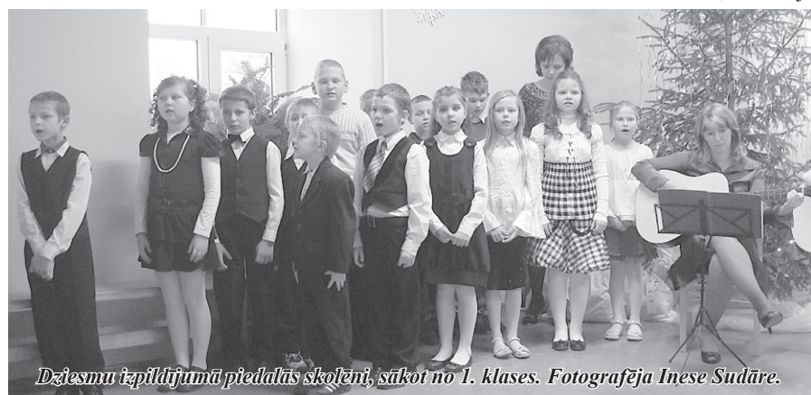
Dziesmu izpildījumā piedalās skolēni, sākot no 1. klases.