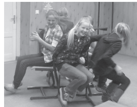
6. klases vakarā spēļu dažādība ļauj priecāties visiem kopā.