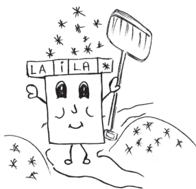
Skurstenīti zīmēja Laila Kaspars 9.kl.