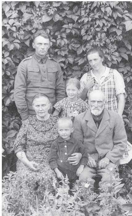
Ieragu ģimene ap 1940. gadu.