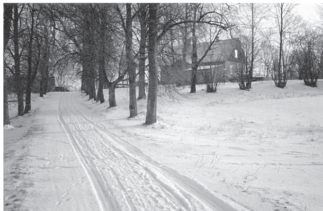
Ceļš uz mājām...

Sākumā doma bija, ka Latvijā iegriezšos tikai caurbraucot, bet sanāca, ka paliku šeit pavisam. Nevar aprakstīt tās sajūtas, ko nozīmē dzirdēt dzimto valodu un savām acīm skatīt to, kas daudzus gadus bija liegts.