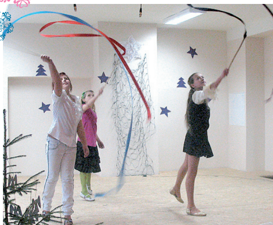
Deja ar lentām.