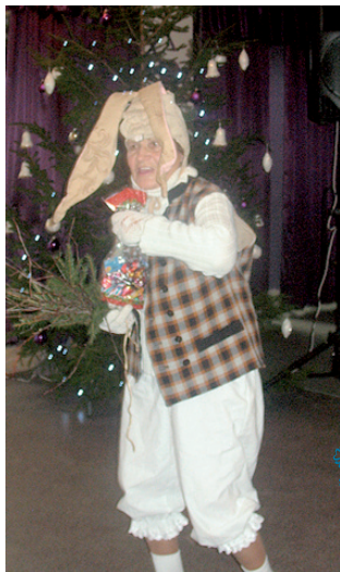
Bez saldumiem nepalika nevienš.