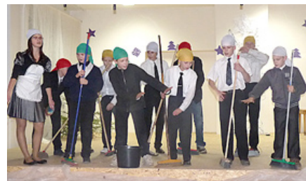
Skolas puīši iejutušies slotu lomā.