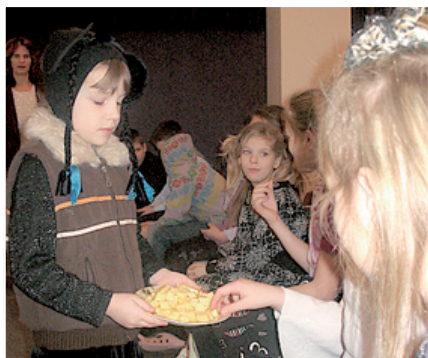
Mazā pelīte daļa siera cienastu.