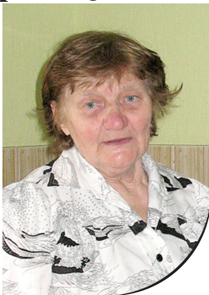
cilvēka dzīve, piesātināta ar pašai dziedzīgu darbu kolhoza „Līdums” lauku brigādē.