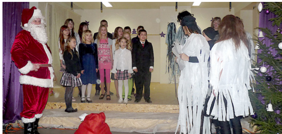
Bērni negrib svinēt Ziemassvētkus kopā ar netīrajiem puteklīniem...