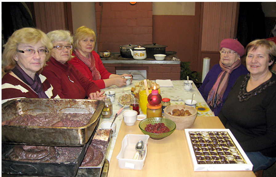
Mētrienas saimnieces svētkiem gatavas.

Viena paciņa vārītu rīsu. Sagriež smalki kāpostu, mazliet apvāra, nokāš, jauc kopā ar rīsiem, 1 kg maltas gaļas, 4 olas, pipari, sāls, ķimenes. Gatavo kā kotletu masu. Cep kā kotletes, pēc tam liek katliņā, pārlej svaigu krējumu, tur uz plīts malās, lai uzsit burbuli. Ir ļoti garšīgi!