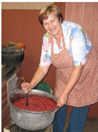
Ligita maisa putru...