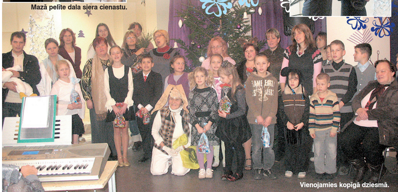
Vienojamies kopīgā dziesmā.