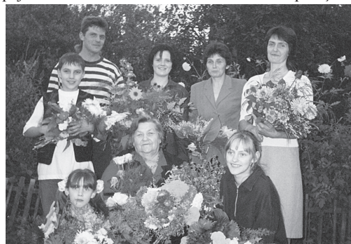
Kopā ar pašiem tuvākajiem jubilejas reizē pirms desmit gadiem.

Jubilāres dzīvesstāstā ieklausījās Valda K.