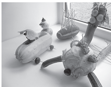
Ar izdomu rudeni ieraudzījusi arī 3. un 4. klase.