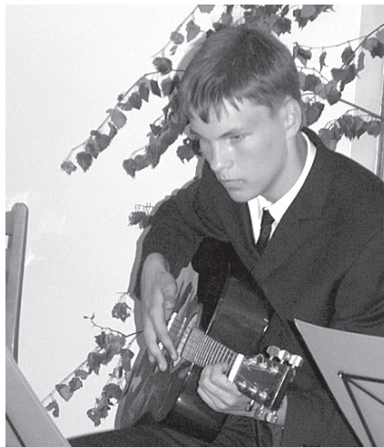
Raitis muzicē izlaidumā, Sarkaņu pamatskolu beidzot.