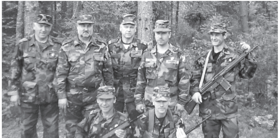
Sarkaņu pagasta zemessargi 2006. gadā.

Vēsturiski šis fakts aizsāka izcilu atjaunotās Latvijas fenomenu – valsts pilsoņu gatavību nākt un aizstāvēt savu valsti, būt valsts cēlājiem un veidotājiem, nevis malā stāvētājiem. Zemessardze gan toreiz, gan arī šodien ir skaitliski lielākais formējums, spēku veids Latvijas Nacionālajos bruņotajos spēkos.