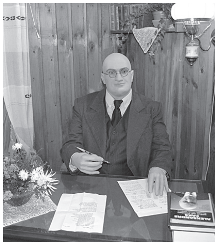
Dzejnieka tēls vismīļīgajās “Pelādēs”.