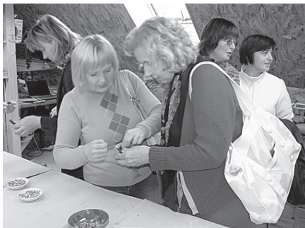
Ekskursijas dalībnieki ādas apstrādes darbnīcās „Mazā kāpa” Koknesē izgatavo atslēgu piekariņus.

Mūsu pārgājiena mērķis bija Biksēres ezers, ejot gar Rēķu kalnu. Kopumā pārgājiens izdevās ļoti labi, neskatoties uz to, ka Lāsma sa-