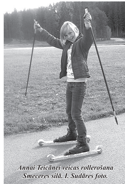
Annai Teicānei veicas rollerošana Smeceres silā.

slima un man bija slapjas kājas. Vairis ar Dairi kā jau parasti uzturēja jautrību, stāstot dažus piedzīvojumus un stāstot kaut ko smieklīgu. Sanāca tā, ka gājām gar manām mājām, un es varēju aizskriet pārvilkot slapjos apavus. Turpinājām pārgājienu uz ezeru. Sakūrām uguns-kuru un cepām desiņas, zefīrus. sanāca jauka pasēdēšana labā kompānijā. Man ļoti patika un noteikti vajadzētu šo pārgājienu atkārtot, tikai uz kādu citu vietu, iekļaujot pārgājienā kādas interesantas nodarbes.