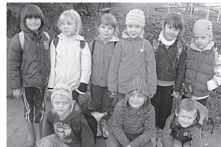
1. klases skolēni devās uz skolas apkārtnes kalniem (Skolas, Žurku, Priežu, Lībiešu). Viņiem patika gan spēles spēlēt, gan uguns-kuru kurināt un cept desiņas.