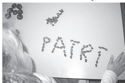
Vārdus var salikt arī no rudens veltēm.