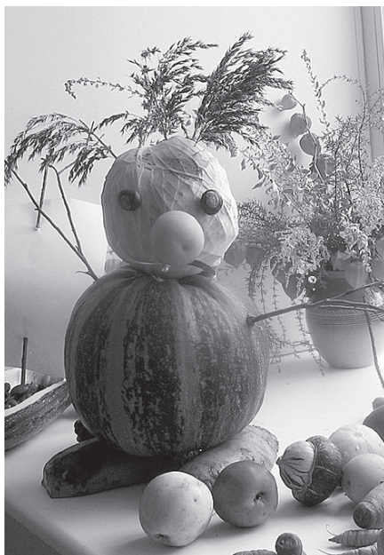
Bērnudārza grupiņā neparastais rudens uz loga.