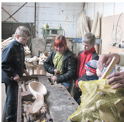
Viktorija izmēģina roku pie karošu grebšanas.

Kaut arī reizēm smidzināja sīks rudenīgs lietutiņš, tas nebūt netraucēja baudīt šo skaisto Vidzemes pērli. Ekskursiju iesākām, apmeklējot Karošu darbnīcu. Ekskursija sākās ar saimnieka stāstījumu par karošu darbnīcu, tad sekoja kopīga izejmateriāla sagatavošana ar nelielu zināšanu pārbaudi par dažādiem kokiem. Nākamais etaps – karotes izgatavošana darbnīcā ar aktīvu līdzdarbošanos, kuras laikā tikām iepazīstināti ar karošu gatavošanas noslēpumiem. Ekskursijas noslēgumā devāmies uz izstādes telpu, kurā varējām gan apskatīt, gan arī iegādāties koka izstrādājumus no vairāk kā 17 koku veidiem. Pēc tam devāmies uz skaistajām Līgatnes alām, vienā no kurām iekārtots vīna pagrabciņš. Bērni degustēja trīs dažādu veidu sulas, mēs – vīnus. Cienastā – vietējo zemnieku gatavots siers. Burvību un romantisko atmosfēru radīja degošās sveču liesmiņas. Izstaigājām klinšu pakalnus, priedējāmies par graciozajiem gulbjiem un baudījām dabas skaistumu. Līgatne ir vēl kāda ļoti pasakaina vieta – Vienkoču parks. Tā platība ir 9,25 ha. Vienkoču parka pamatkonceptija ir balstīta uz koka amatniecības un vienkoču izstrādājumu popularizēšanu. Šī parka izveides pamats balstās uz iespējami