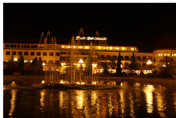
Viesnīca Golebiewski vakara gaismās. Viesnīcā atrodas ūdens atrakciju parks Tropikana.