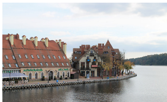
Skats uz Mikolajku pilsētiņu.