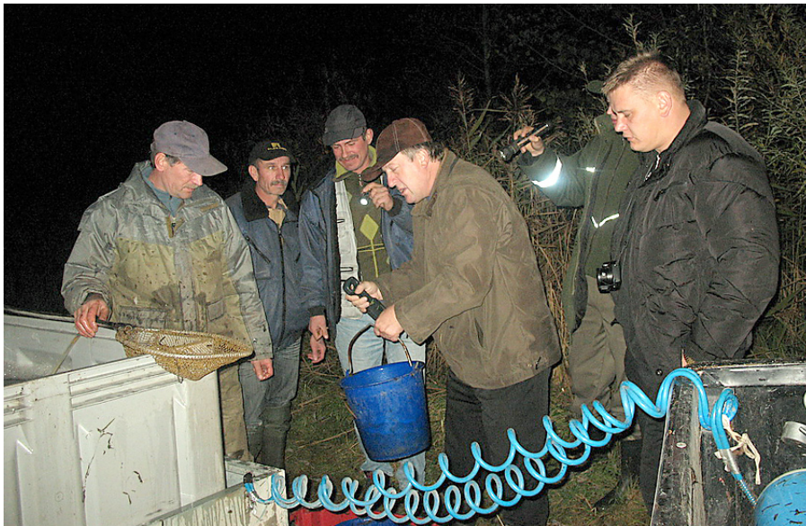
Zivju laišana Odziena ezerā.