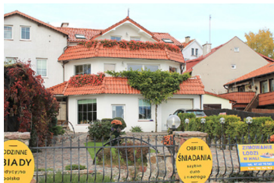
Mikolajku pilsētiņā tūristus sagaida daudzas skaistas viesnīcas.

Neilgajā divu dienu braucienā guvām daudz patīkamu iespaidu par Poliju un iesa-