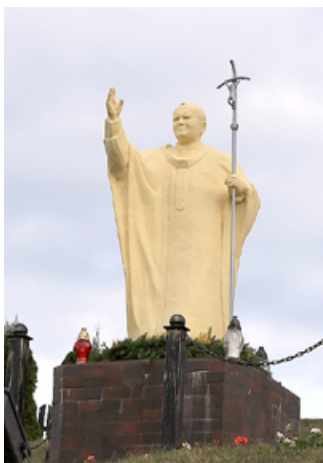
Jāņa Pāvila II skulptūra pie kādas baznīcas.

pilsētas, bijušajā Austrumprūsijas teritorijā, kas kādreiz piederēja III Reiham. Mežā 250 hektāru platībā bija ierīkoti bunkuri, kuros dzīvoja apmēram 3500 vācu armijas militāro personu. Bunkuru būvēja nepārtraukti no 1940. līdz 1944. gadam, bet tuvējiem iedzīvotājiem tika stāstīts, ka tur būvē ķīmisko rūpnīcu un tādēļ labāk pārvākties uz citu dzīvesvietu. Uz ēku jumtiem tika uzbērtā zeme un stādīti koki, virs bunkuru teritorijas bija novilkta maskēšanas tīkli. Bunkuru sienas un griesti bija iespaidīgi, 6–10 metrus biezi, bet apkārt visai teritorijai bija 150 metru plats minu lauks. Lielākā daļa bunkuru kara beigās tika uzspridzināti. Diezgan jocīgas bija sajūtas, staigājot pa tām pašām vietām, kur agrāk staigājis Hitleris un citi vācu armijas virsnieki. Bet šīs sajūtas drīz vien aizmiršās un varējām baudīt Polijas rudenīgo dabu, veroties caur autobusa logiem.