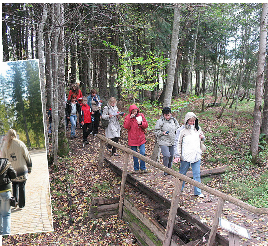
Pa Vienkoču parka takām.