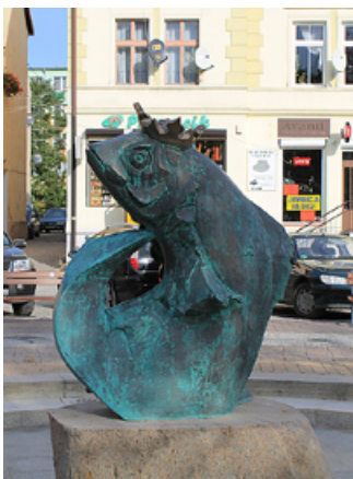
Zivju ķēniņa skulptūra pilsētas centrā.

Gluzī pretējas noskaņas mūs sagaidīja „Vilkmu midzenī”, kas bija Hitlera vācu armijas virspavēlniecības mītne. Tā atradās Polijas teritorijā piepilsētas mežā pie Rastenburgas