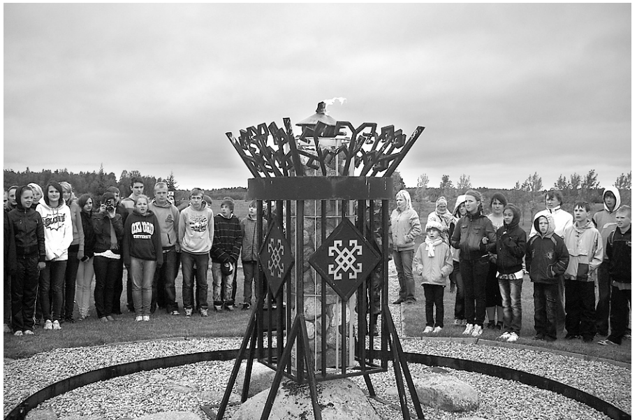
Tiek iedegta Ticības liesma.