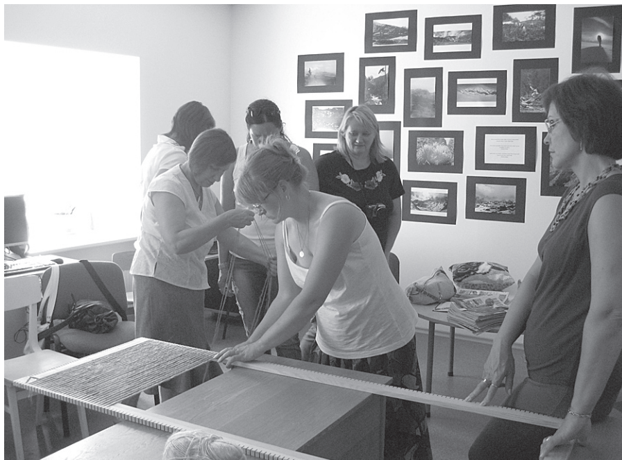
Radoša darbošanās bibliotēkas telpās.

kurā top daudz skaistu lietu visdažādākajās rokdarbu tehnikās.