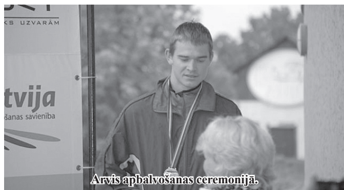
Arvis apbalvošanas ceremonijā.