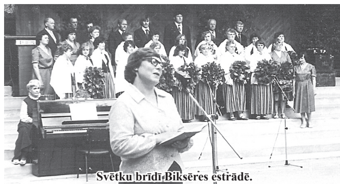
Svētku brīdī, Bikšēres estrādē.

Es neticu, ka var bez cilvēkiem, es vienmēr esmu tiekusies uz tiem.... „Mūsu laiks” – tā tiekoties saka manas paaudzes cilvēki. Mēs strādājām ar aizrautību, stundas neskaitot. Atradām laiku gan darbam, gan svētku brīžiem. Kolhoza vadība domāja ne tikai par ražošanu, bet arī par darba apstākļiem, atpūtas un svētku brīžiem. Ja bija sakārtota sadzīve, arī darbi veicās labāk. Kopā strādājām, kopā svētkus svinējām. Līgo svētkus svinējām arī tad, kad to darīt īpaši vēlams nebija. Dēvējām tos par „Darba un draudzības svētkiem”, bet datums gan palika nemainīgs 23. jūnijs. Vērienīgākais pasākums manas darbības laikā bija kolhoza „Sarkanais stars” 35 gadu jubilejas svinības. Saviļņojošs brīdis bija, kad estrādē lēniem solīšiem kāpa vecie ļaudis, atbalstoties uz spieķīša vai drauga pleca. Viņi piedzīvojuši kolhoza pirmsākuma grūtus gadus.