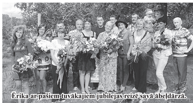
Ērika ar pašiem tuvākajiem jubilejas reizē savā ābeļdārzā.

Vēl tagad esmu ļoti emocionāli uzlādēta ne tikai kā nosvinētās jubilejas. Kopā bija visi manējie – ģimene, radi, draugi un bijušie darba biedri... neaizmirstams svinību brīdis zem ražas pilnajiem ābeļu zariem, pēc tam atmiņas un sadzīves sarunas mājās. Likās, ka laiks apstājies, un mēs atkal esam enerģijas un dzīvesprieka pilni.