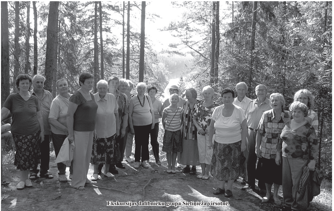
Ekskursijas dalībnieku grupa Sietiņieža virsotnē.