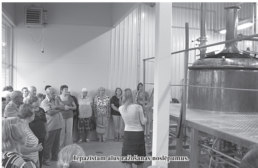
Iepazīstam alus ražošanas noslēpumus.

tuberkalozes slimnīca. Tagad grezna pils, kurā uzņemts arī seriāls, kuru iecienījuši daudzi. Nevienu vienaldzīgu neatstāj greznās telpas, sakoptais parks un skaistās puķu dobes. Ir jau vēla pēcpusdiena, mazliet jūtams nogurums, bet tas netraucē ekskursiju turpināt. Nākošā pieturvieta Zilaiskalns. Zilaiskalns atrodas Burtnieku līdzenumā, 12 km uz rietumiem no Valmieras. Tā absolūtais augstums ir 126,7 m virs jūras līmeņa, un tas paceļas 66,6 m virs apkārtējā pārpurvotā un lēzeni viļņotā līdzenuma. No virsotnē esošā torņa paveras skats uz Augstrozes paugurvalni. Skaidrā laikā var redzēt Burtnieku un citus apkārtnes ezerus, aplūkot Vidzemes pilsētas. Redzamība var sasniegt pat 50 km. Zilā kalna virsotne ir aptuveni 1 ha liela, un to veido vairākās galotnes