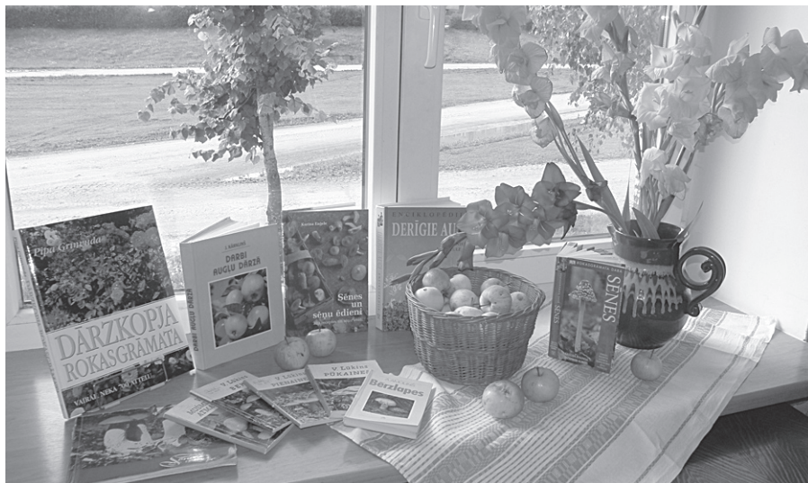
Bibliotēkas apmeklētājus priecē arvien jaunas izstādes.

Gaidīšu Jūsu priekšlikumus un ierosinājumu, lai kopīgi veidotu grāmatu fondu, kas interesē pēc iespējas vairāk lasītāju.