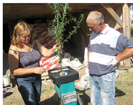
Saimniece demonstrē savu šķeldotāju.