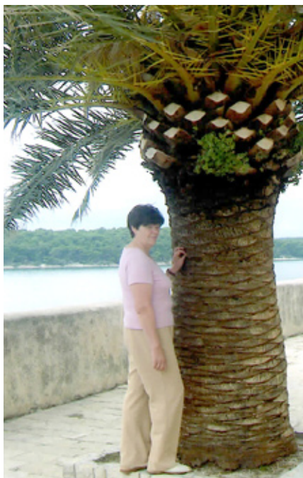
Lai daudz ceļojumu!

Zinot mūsu direktori kā kolēģi un bijušo skolotāju, ir skaidrs, ka šobrīd ir grūti. Bet ir sācies skaists laiks. Beidzot var vēlīt laiku sev, izbūvēt skaistus mirklus kopā ar saviem mīļajiem. Lai izdodas!