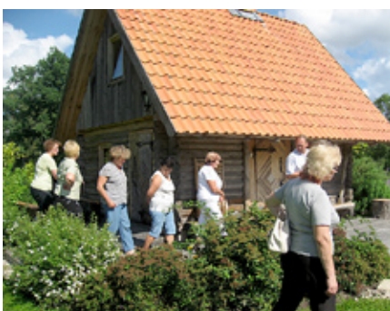
Pastaiga pa Eriņu dārzu.