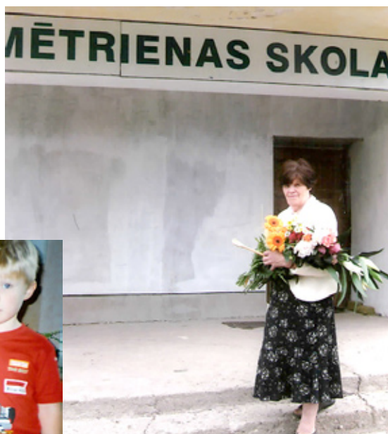
Atgriešanās no pēdējā direktoru semināra.