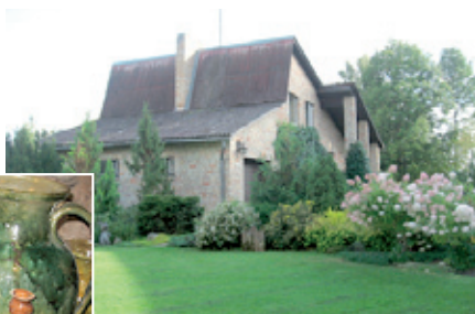
Seikstu ģimenes māja.

iekoptajiem dārziem, savām iecerēm. No šī brauciena es guvu tikai vislabākās emocijas un, kas zina, varbūt arī pati ko varēšu dzīvē ieviest.”