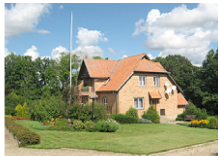
Eriņu ģimenes māja.