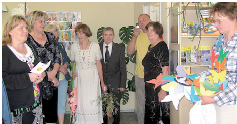
Svētku diena kopā ar darba kolēģiem.