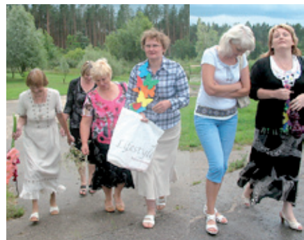
Pa Mētrienas ieliņām...