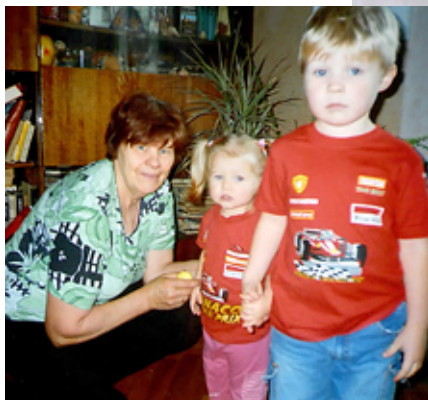
Lai jauki mirkli kopā ar mazbērniem.