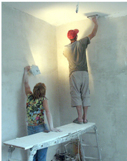
Darbi jaunajā skolotāju istabā.