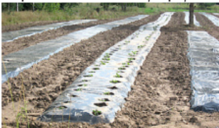
Mairitas jaunās zemeņu dobēs.