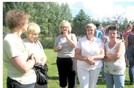
Pēc kā garšo dienziēdes.