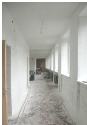
Pavisam drīz šo gaiteni pieskandinās skolēnu čālas.