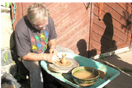
Keramiķis demonstrē savu amata mākslu.