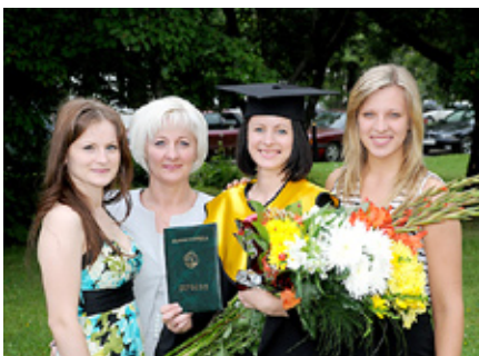
Jana mātas Diānas izlaidumā.