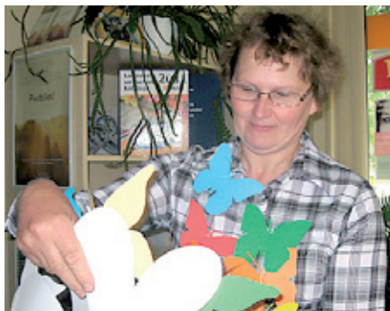
Jāatrod piecdesmit taureņi...

Un ilgāk par mirkli Nekas nespēj būt. Un vairāk par mirkli Mums neiegūt! Un daudz tas nav – Bet tas ir viss.