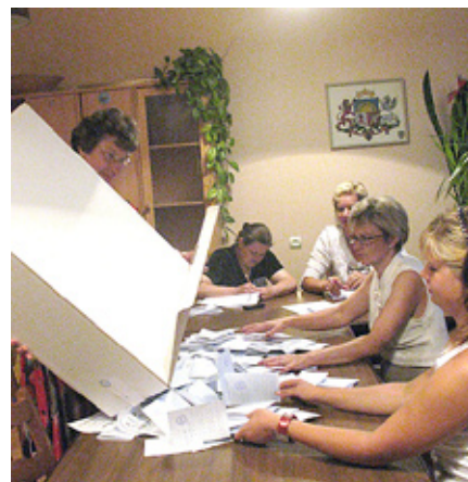
Un sākas darbs pie balsu skaitīšanas...

Tikko esmu atbraukusi no neliela ceļojuma pa ārvalstīm un nezinu, kādas ir aktivitātes Latvijas politikā. Uz vēlēšanām