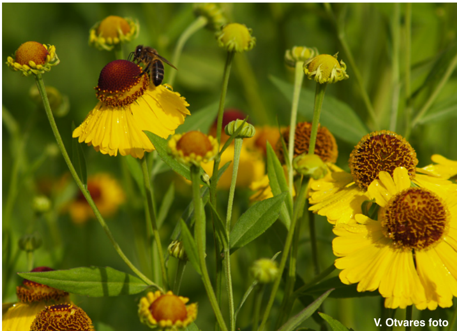
V. Otvares foto

Izdod Mētrienas pagasta pārvalde 2011. gada jūlija avīze Nr. 154