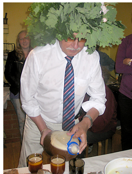
Pats pagasta pārvaldes vadītājs visus cienāja ar Jāņu alu.