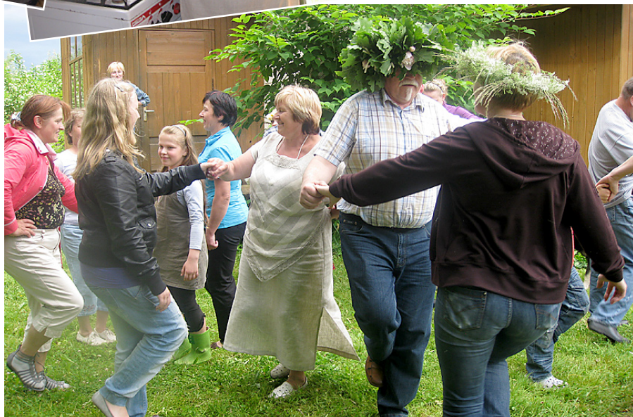
Jauniešu deju kolektīvs „Metenis” visus lustīgi izdancināja.