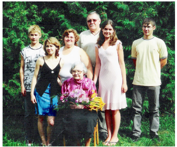
Astoņdesmit gadu jubilejā.