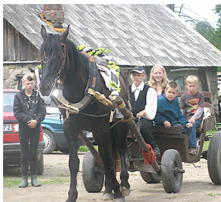
Ak, šīs jaukās izjādes!