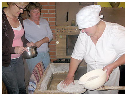
Neba maize viegli nāca...