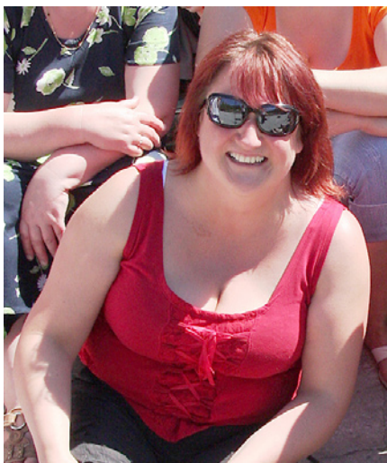
Madonas pilsētas svētkos 2011. gada jūnijā. Korim šis bija 200. pasākums.