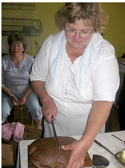
Pirms ēšanas ar nazi uzvelk krustu uz maizes, lai Dievs to svētī.