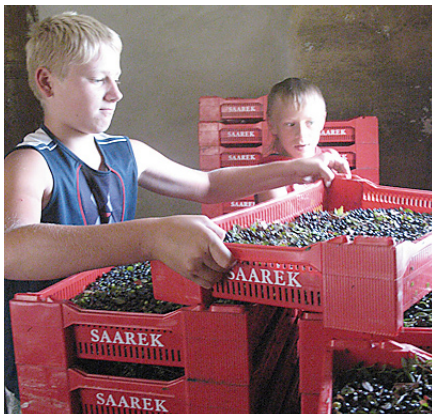
Roberts un Brajens vasarā strādā.