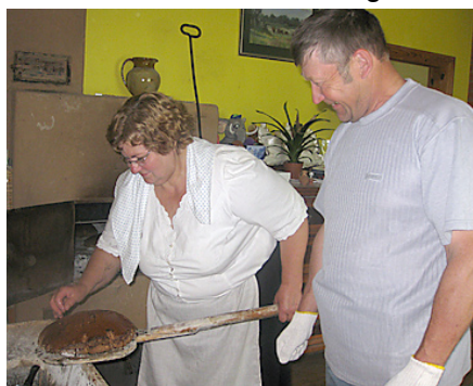
Bez nama tēva Viļņa stiprās rokas neztikt...