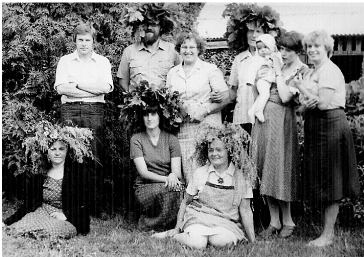
1984. gada Jāņi.

Ar mīlestību, mazmeitas