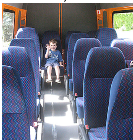
Autobusa salons ir ērts un plašs.