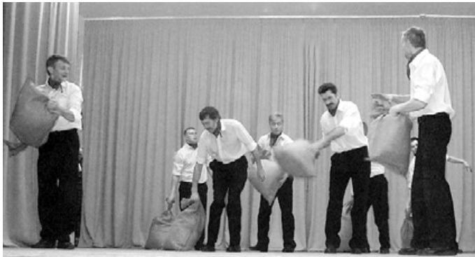
Mētrienas puīši dejo „Es bij puika man bij vara”.

Doma par šādu sadancošanu radās dejojājiem kādā no mēģinājumiem. Mēs tikai dejojām, dejojām, bet būtu jāredz arī, ko citi dara! Un tā tas viss lēnām tapa – meklējām kontaktus ar kolektīvu vadītājiem, drukājām ielūgumus un gaidījām viesus.