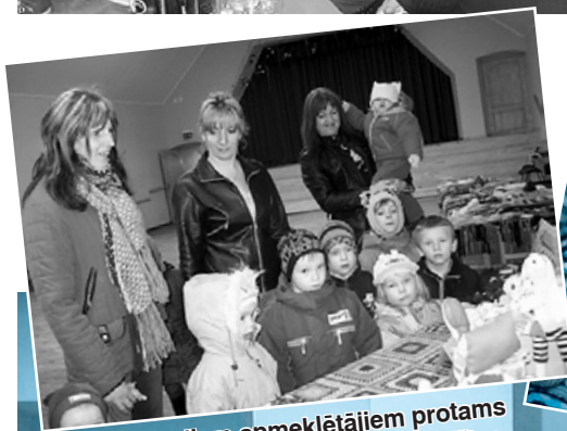
Mazajiem apmeklētājiem protams visvairāk patika lellītes.