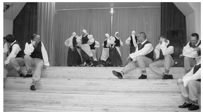
Vērēmu pagasta dejojāji.

skatienu. Dejojām sev un savam priekam. Mēģinājumu laiks ir mūsu laiks. Tas ir mūsu kopā būšanas mirklis – skaists, neatņemams, neatsverams.