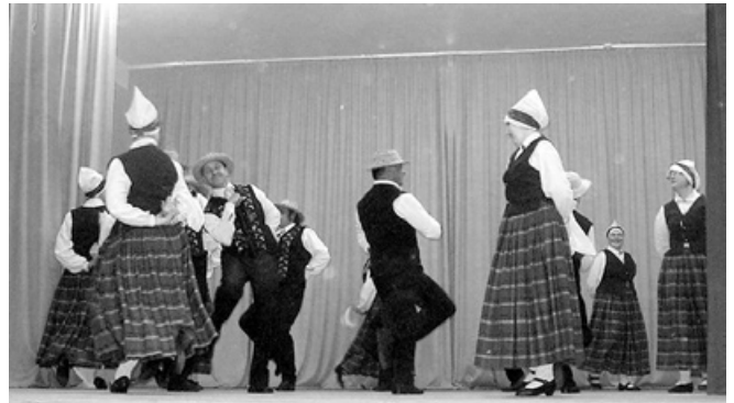
Dejo Ļaudonas „Divi krasti”.

Manis vadītais Mētrienas tautas nama vidējās paaudzes deju kolektīvs ribināt skatuves dēļus divas reizes nedēļā sanāk kopš pērnā gada rudens. Cītīgi meklējam kolektīvam nosaukumu, bet tiklīdz kāds mums pieņemams atrodas, izrādās, kāds jau pasteidzies. Bet idejas ir. Mums gan vairāk patīk jautras dejas, bet kāpēc gan reizēm neizvēlēties kaut ko sentimentālāku? Nu tā, lai ciešāk sajustu partnera plecu un dāvātu acu