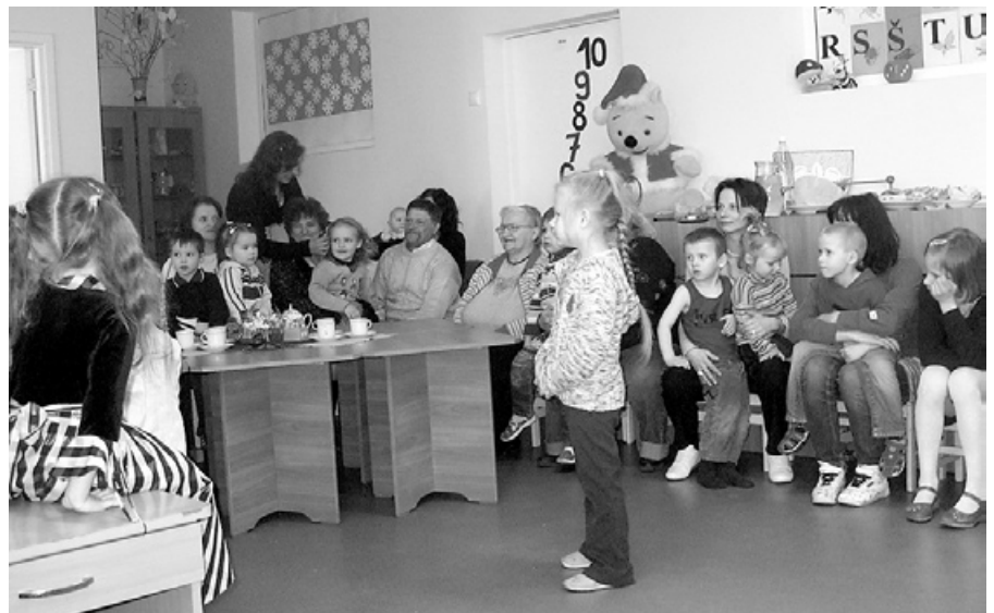
Mēs jūs visus ļoti gaidījam!

Audzinātāja Aiga Ivāna Solvītas Stulpīnas foto