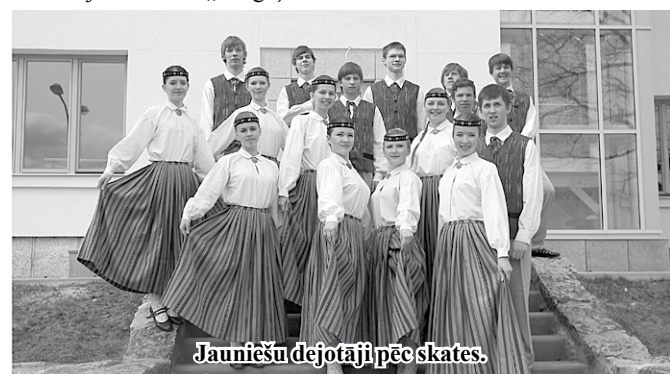
Jauniešu dejojāji pēc skates.

26. martā Lubānas jauniešu deju kolektīvu sadancī piedalījās jauniešu deju kolektīvs „Resgaļi”.