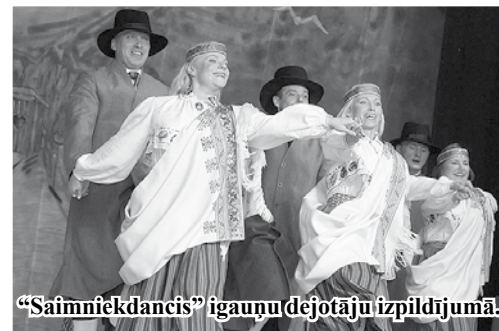
“Saimniekdancis” igauņu dejojāju izpildījumā.

Tikšanās laikā risinājās arī draudzīgas sarunas par kolektīvu darbību, par turpmāko sadarbību un jaunu tikšanos jau šogad. Mājupceļā „Labākie gadi” baudīja pavasara saulīti visa ceļa garumā, veldzējās pie Rīgas jūras līča. Divas die-