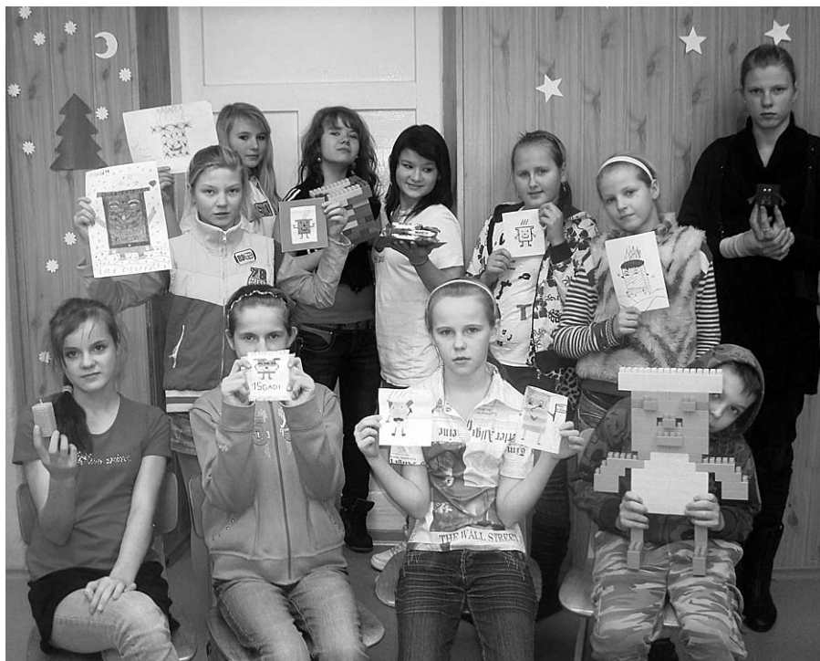
Avīzes veidotāji – „Skursteņa” redakcija ar izstādei gatavotajiem skurstenīšiem.

Bibliotekārei jautāja un ziņas pierakstīja Endija Zvirgzdiņa 5.kl.