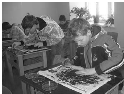
6./7. klases skolēni ir ieinteresēti praktiskajā nodarbības daļā.

ka 2011. gada putns ir meža pūce. Par katru uzdoto jautājumu varēja iegūt vienu uzlīmīti.