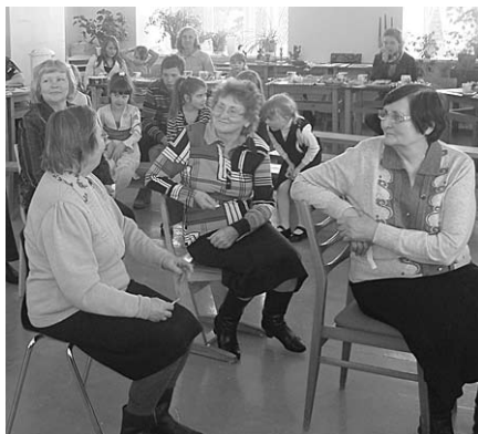
Kopīgās spēles raisa prieku.

Pēcpusdienas saviesīgajā daļā vecvecāki vieni paši vai kopā ar saviem mazbērniem „strādāja” dažādās aktivitātēs: izspēlēja pasaku, darināja pavasara sezonai tērpus no viegla un caurspīdīga materiāla (no maisiņiem), zīmēja afišu u.c.