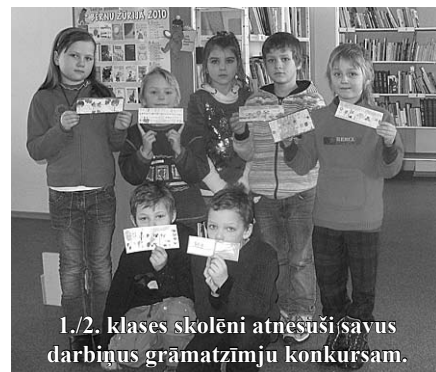
1./2. klases skolēni atnesuši savus darbiņus grāmatzīmju konkursam.