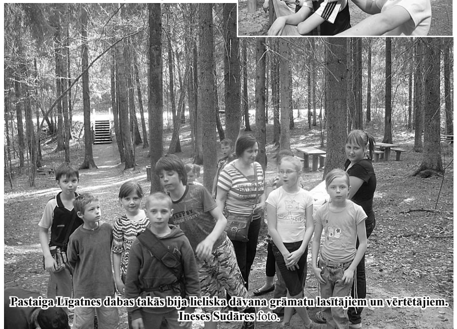
Pastaiga Līgatnes dabas takās bija lieliska dāvana grāmatu lasītājiem un vērtētājiem.