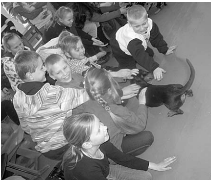
Līdzī atvestie taksīši sagādā skatītājiem patiesu prieku.