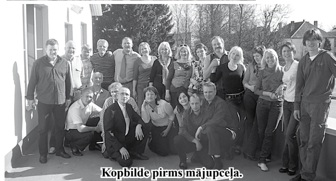
Kopbilde pirms mājupceļa.

nas aizritēja kā mirklis, kurš deva jaunu, pozitīvu enerģiju kolektīvu turpmākai draudzībai.