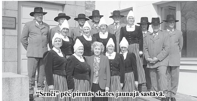
“Senči” pēc pirmās skates jaunajā sastāvā.

19. februārī ikgadējā senioru deju kolektīvu sadancī Kalsnavā piedalījās deju kolektīvs „Senči”.