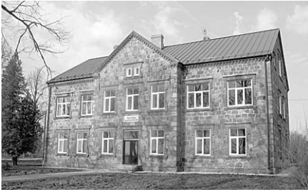
Skolu aprīlī