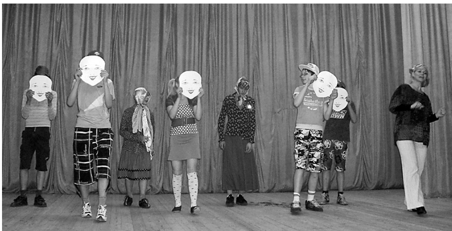
Jokojas 7. klase.

Pasākuma laikā no skolēniem dzirdējām gan anekdotes, gan muzikālus priekš-