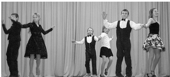
Moderno deju pulciņš.