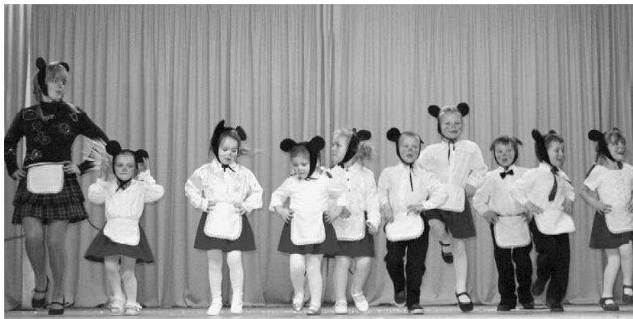
Uzstājas pirmsskolas grupa.