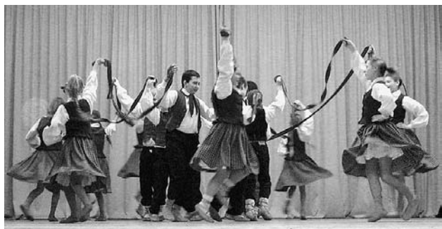
Dejo 3. – 6. klašu tautisko deju kolektīvs.