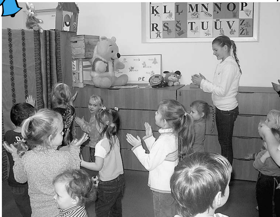
Varējām arī uzdejot.