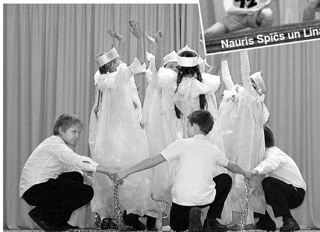
3. – 4. klases uzstāšanās.