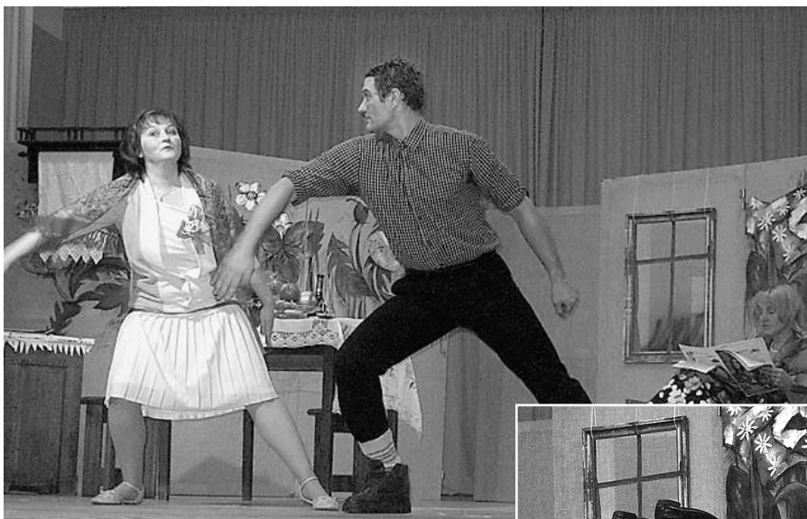
Foto – epizodes no izrādes