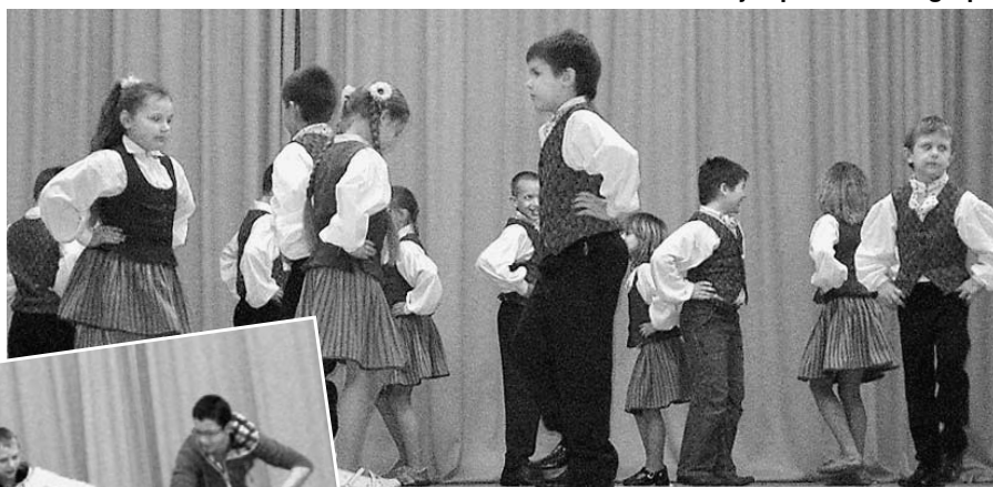
Dejo 1. – 2. klašu tautisko deju kolektīvs.