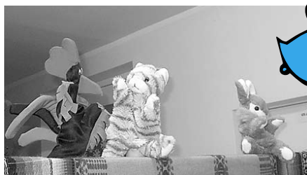
Lelles pašu skolotāju gatavotas.