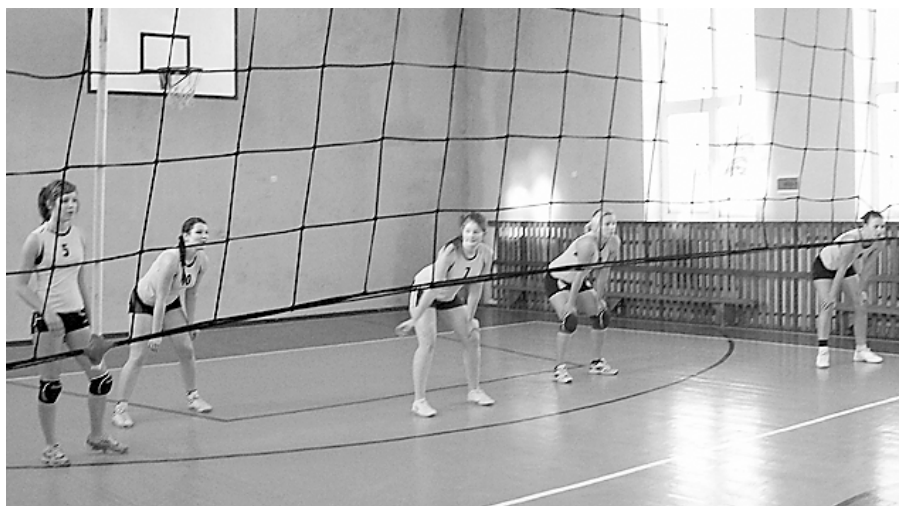
Spēlē Varakļāņu komanda.