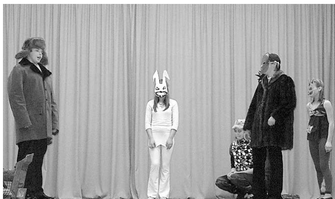
8. – 9. klases teātris.