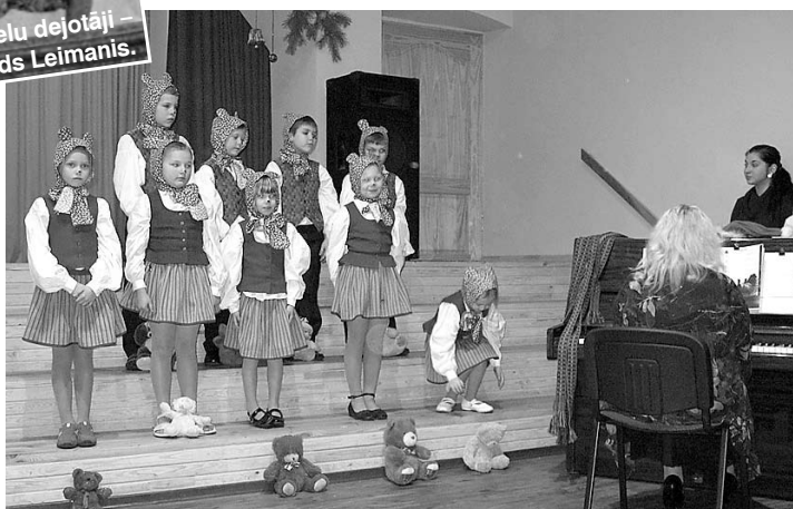
1. – 2. klases uzstāšanās.