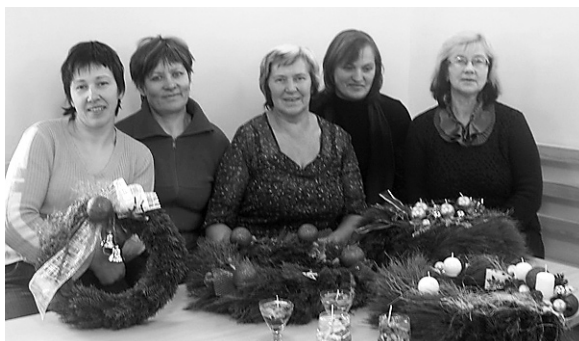
Adventes vainagi gatavi!