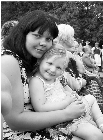
Ar meitņu kādā koncertā.

lauku darbus arī biju darījusi. Man pat bija sapnis dzīvot laukos. Tā, ka uzskatu, ka tā nav problēma. Pie visa var pierast.