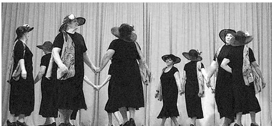
Dāmu deju grupa.