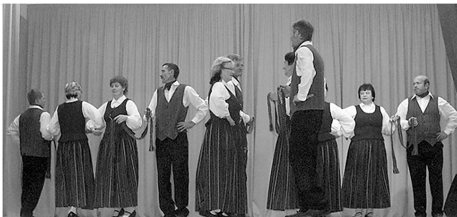
Vidējās paaudzes deju kolektīvs.