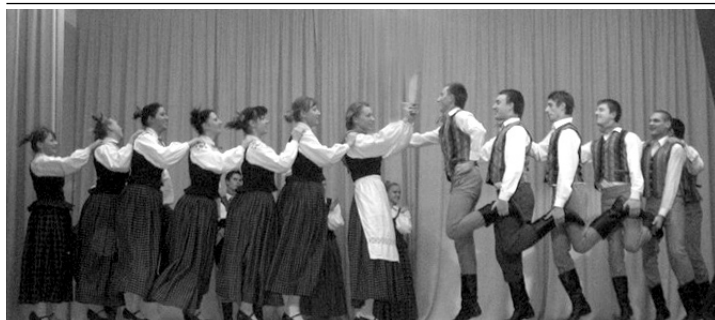
Jauniešu deju kolektīvs.