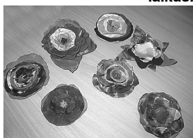
Labs darbs, kas padarīts.