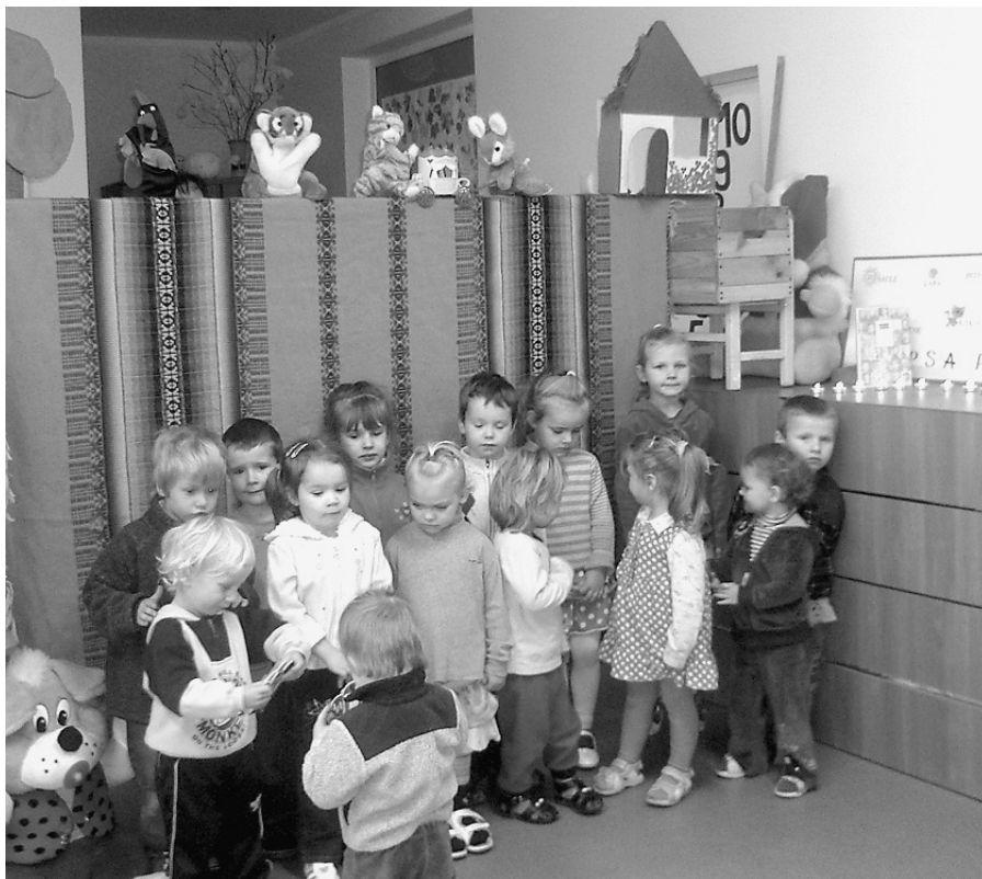
Mums ir pašiem savs leļļu teātris!