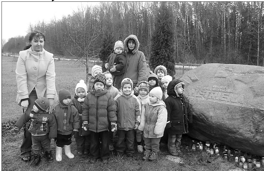
Latvijas valsts dzimšanas dienā pie Piemiņas akmens.

Notikumu virpulī līdzī bija Solvita Stulpiņa