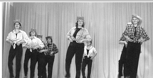
Līnijdeja dāmu izpildījumā.