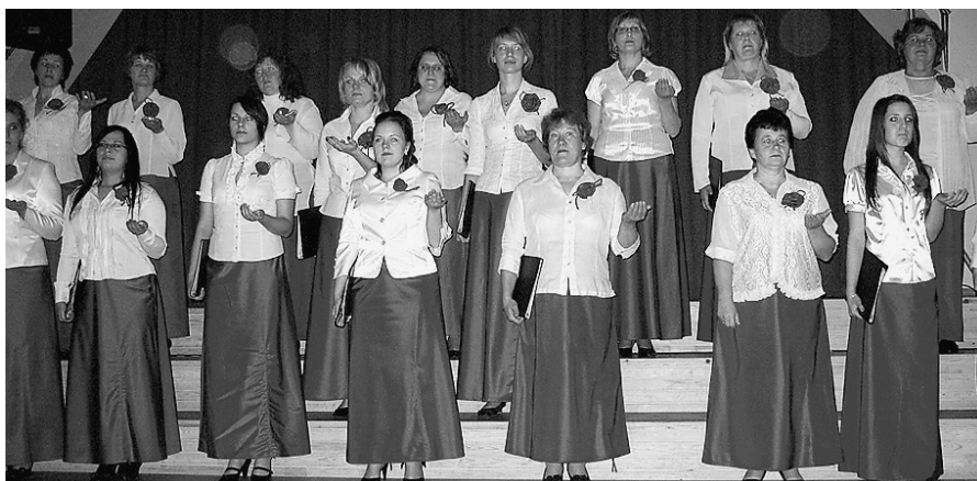
Sieviešu koris „Jūsma”.