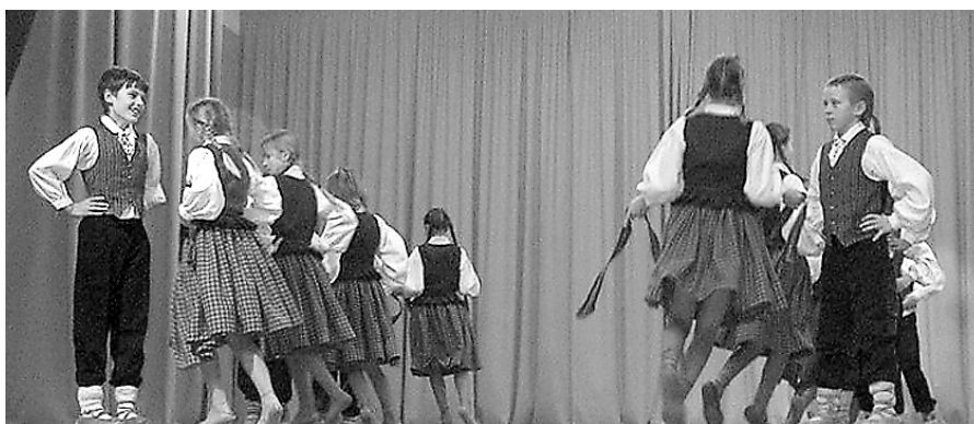
Dejo Mētrienas pamatskolas 4. – 6. klašu tautisko deju kolektīvs.