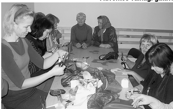
Top skaistas puķu rotas.

Ja esi nomākta, ja tev ir sliktas garastāvoklis vai vienkārši nav ko darīt, tad noteikti apmeklē kādu no sieviešu kluba "Ābele" nodarbībām. Te patiesi valda sapratnes, labestības un vienkāršības aura un pāri visam – vēlme darboties, tieksme arvien iemācīties kaut ko jaunu.