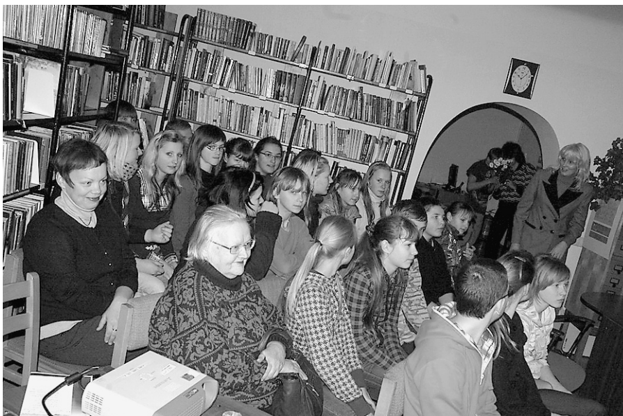
Klātesošie ar interesi klausījās un skatījās.