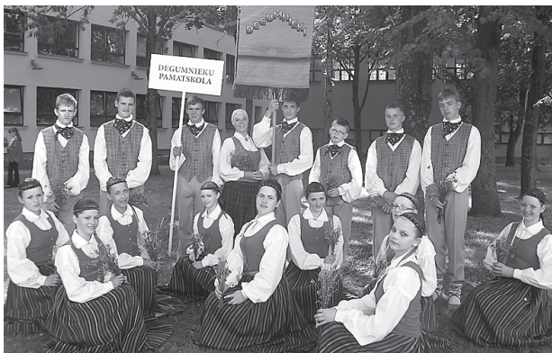
5. – 9. klašu deju kolektīvs.