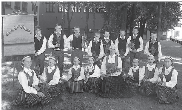
3. – 6. klašu deju kolektīvs.

Cieš! Tas ir sāpīgs jautājums! Ko darīt?!