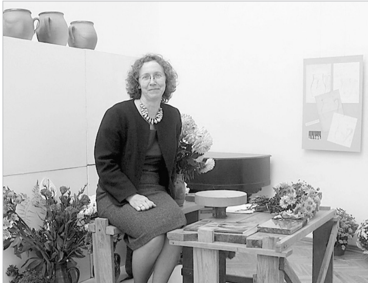
Šodien virpa goda vietā.