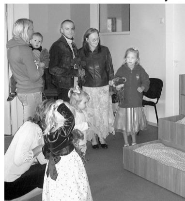
Vecāki un bērni iepazīstas ar izremontētajām pirmskolas vecuma grupas telpām.