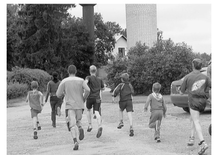
Skrējienā Apkārt Mētrienu.