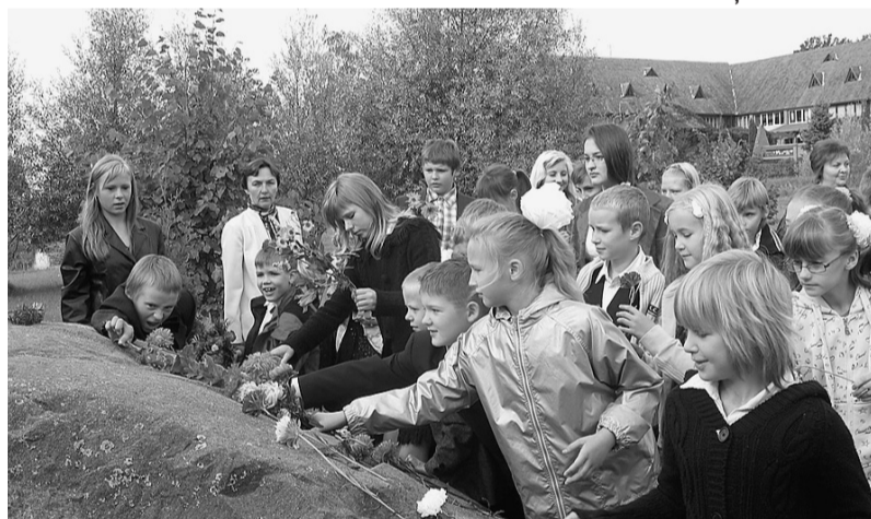
Ziedu nolikšana pie Piemiņas akmens.