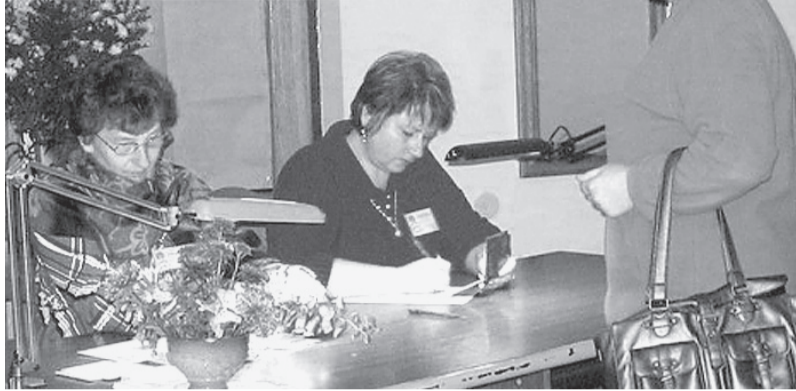
Piedalīties vēlēšanās ir katra valsts pilsoņa pienākums.