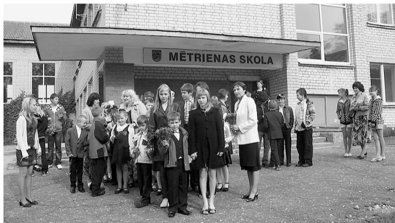
Pirms došanās uz Piemiņas akmeni.