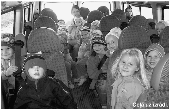
Ceļā uz izrādi.

Septembrī „Saulsazāķēni” jau ir paguvuši piedalīties zīmējumu konkursā, ko rīkoja LNT raidījums „Kas