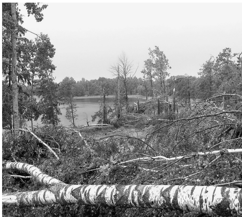
Šeit bija Zviedrukalna atpūtas vieta.

Solvita Stulpiņa