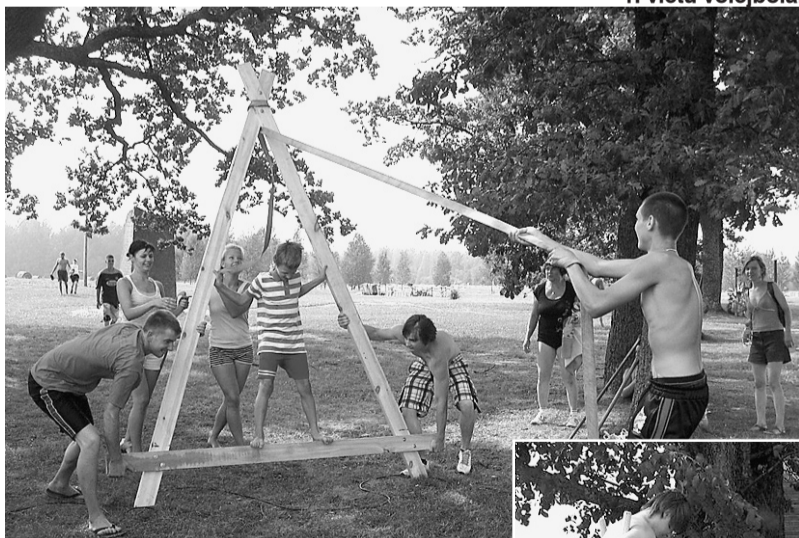
Mētrienas komanda stafetē.