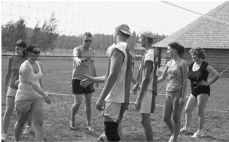
Mētrienas komanda finālā pārspēja ļaudoniešus.