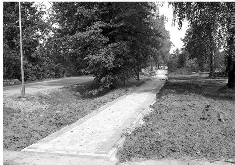
Būs ērti un skaisti.