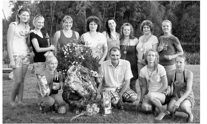
Kopīga fotografēšanās pēc uzvaras.