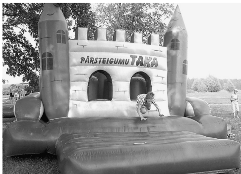
Stafetē savu veiklību pierāda Haralds Iesalnieks.