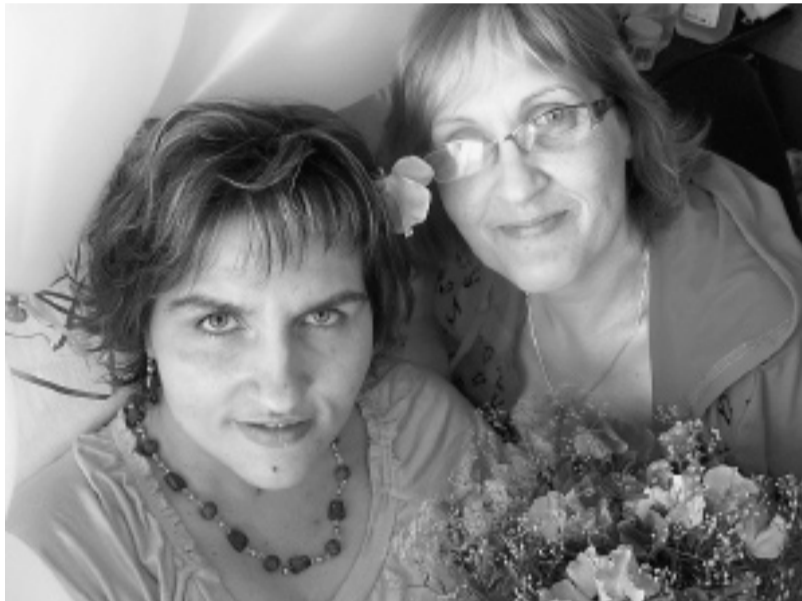
...ar mammu Anitu.

tēvs. Tad bija laiks, kad par policistu. Man ir gluži vienalga, par ko viņš strādās. Galvenais, lai padodas un patīk. Un ja vēl maksā, tad pavisam lieliski.