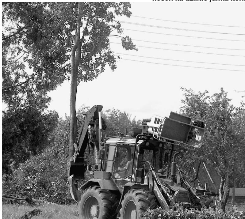
Latvenergo darbinieki atbrīvo elektrības vadus.