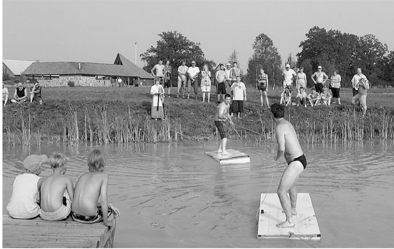
Cīņas uz ūdens.