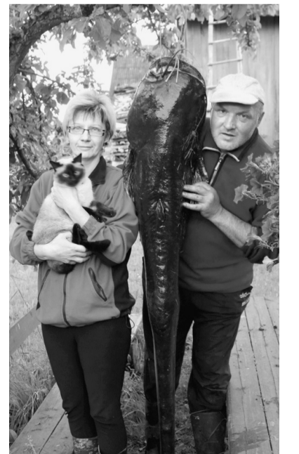
Ar lielo lomu.

Viktora makšķerēšanas stāstu pierakstīja Solvita Stulpiņa