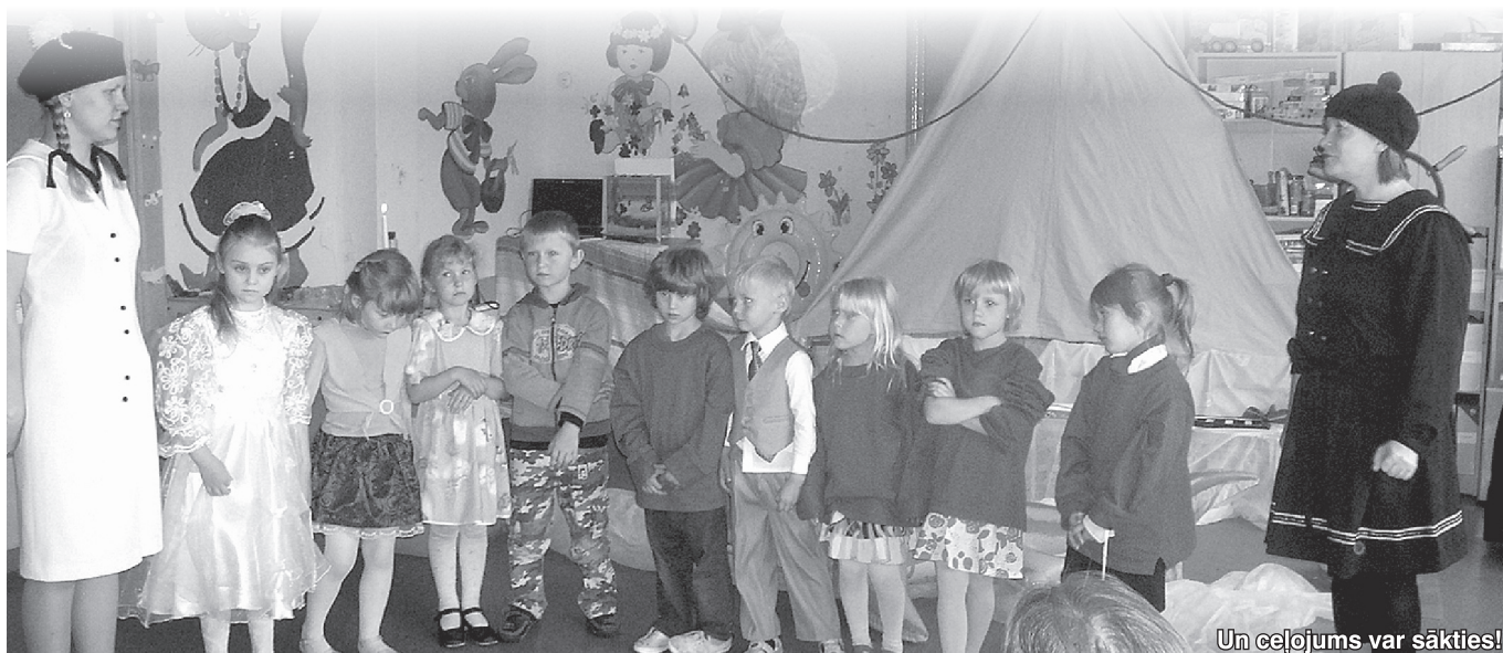
Un ceļojums var sākties!