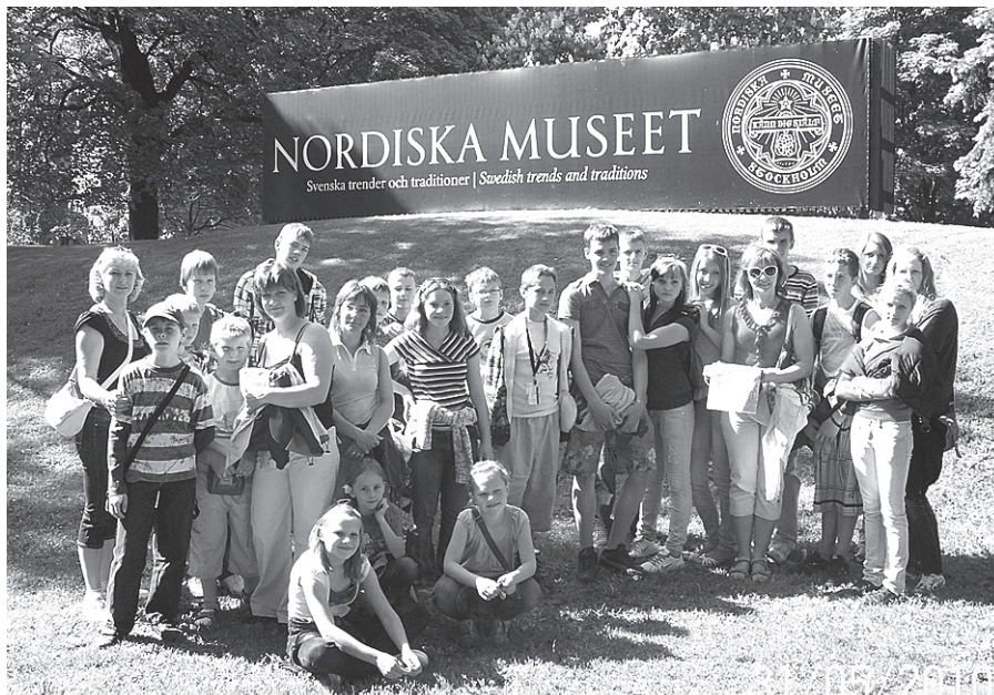
Pie nacionālā kultūras vēstures muzeja.

Skolēniem ekskursijas patīk vienmēr, bet ceļojums ar prāmi uz Stokholmu likās kas īpašs. Par šo braucienu uz Zviedrijas galvaspilsētu visiem paliks tikai pašas labākās atmi-