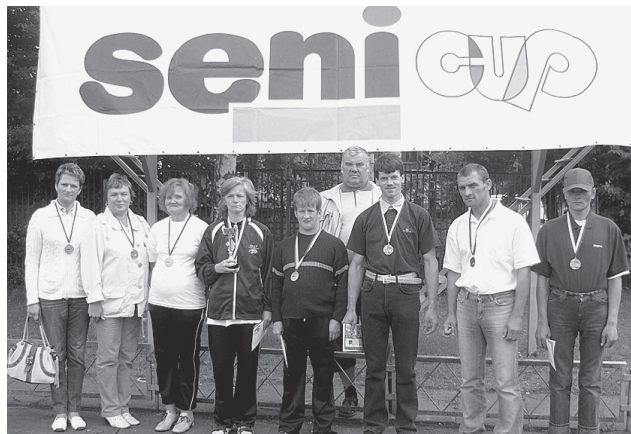
Mūsu komanda pēc sacensībām.

Katra komanda par piedalīšanos turnīrā saņēma kausu un futbolu bumbu, bet komandu pārstāvji balvās saņēma „Seni Cup” medaļas un veicināšanas balvas (T krekli, cepures, rakstāmpiederumi).