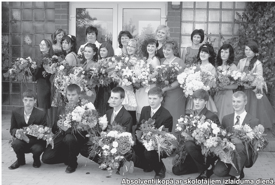
Absolventi kopā ar skolotājiem izlaiduma dienā.