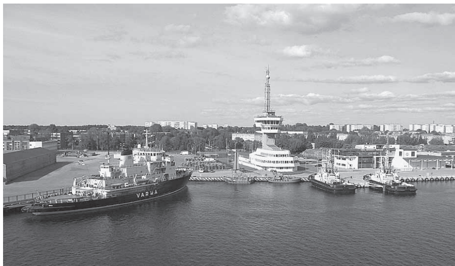
Ekskursantus sajūsmināja daudzie kuģiši.