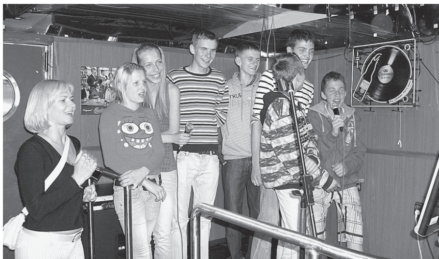
Uz prāmja varēja dziedāt karaoke.

ņas – jūra, vējš, atrakcijas, romantika, tā vien gribētos vēl kādreiz paceļot.