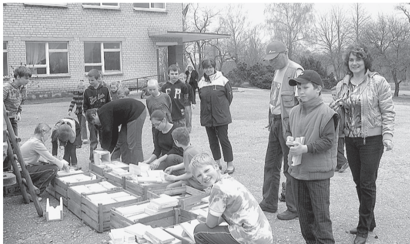
Mācāmies gatavot putnu būrišus.