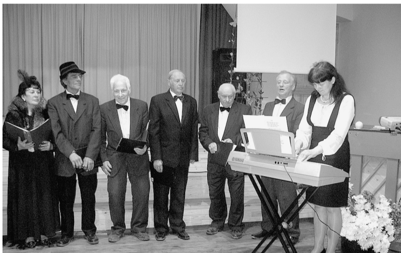
Jubilejā sveic draugi no Ropažiem.