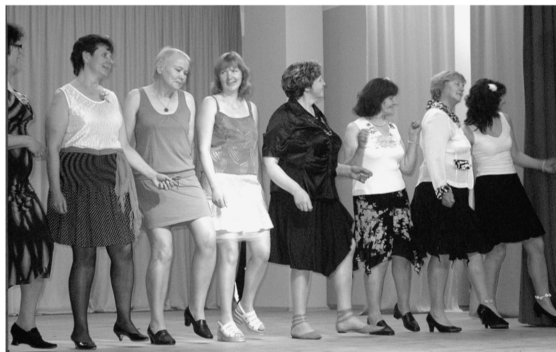
Dejo Orhidejas no Degumniekiem.