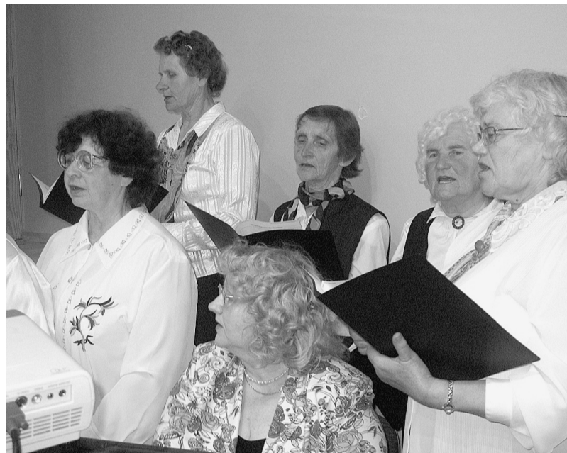
Sieviešu vokālais ansamblis.