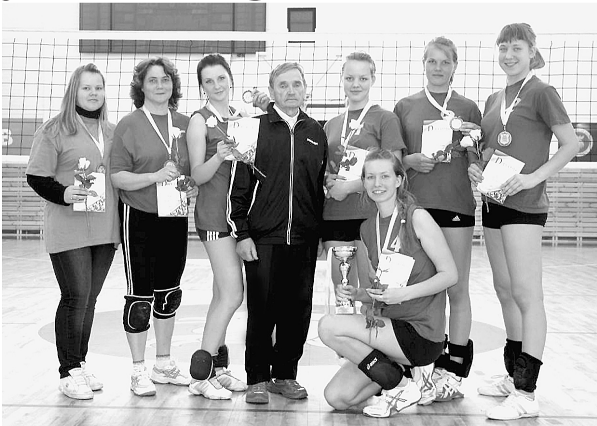
Meitenes un treneri ar kuriem lepojamies.