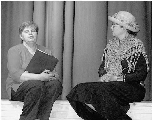
Patiesu humora dzirksti dāvāja Nagļu meitenes.