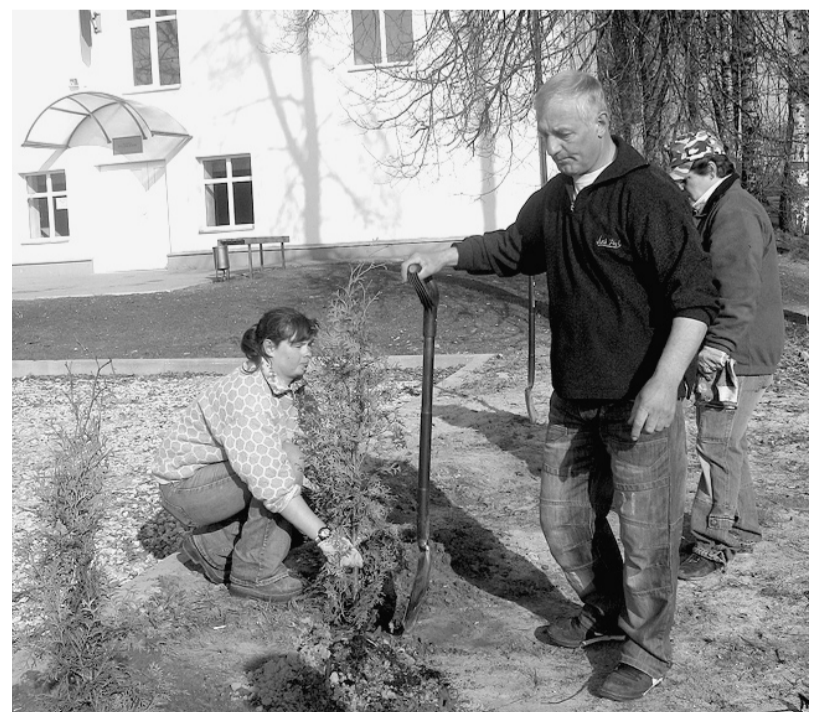
Koku stādīšana pie Mētrienas tautas nama.