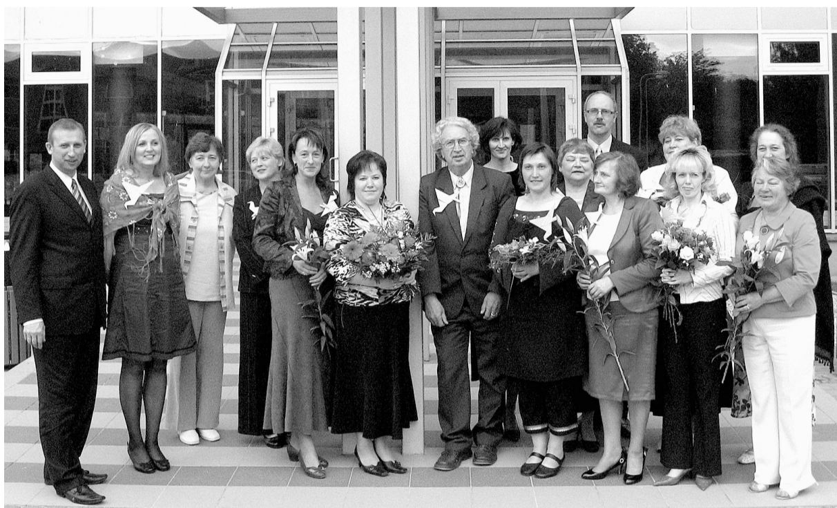
Avīžu redaktori pie Cesvaines vidusskolas.