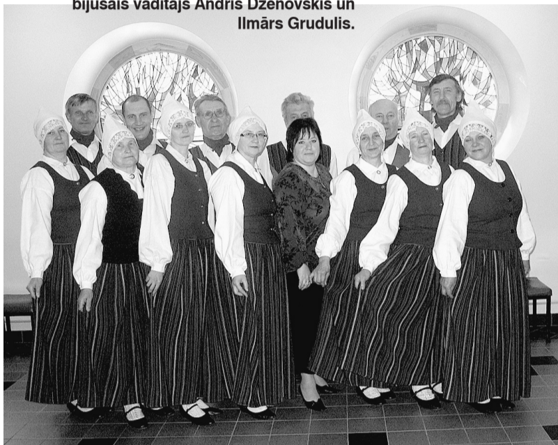
Senioru deju kolektīvs pēc skates Madonā.