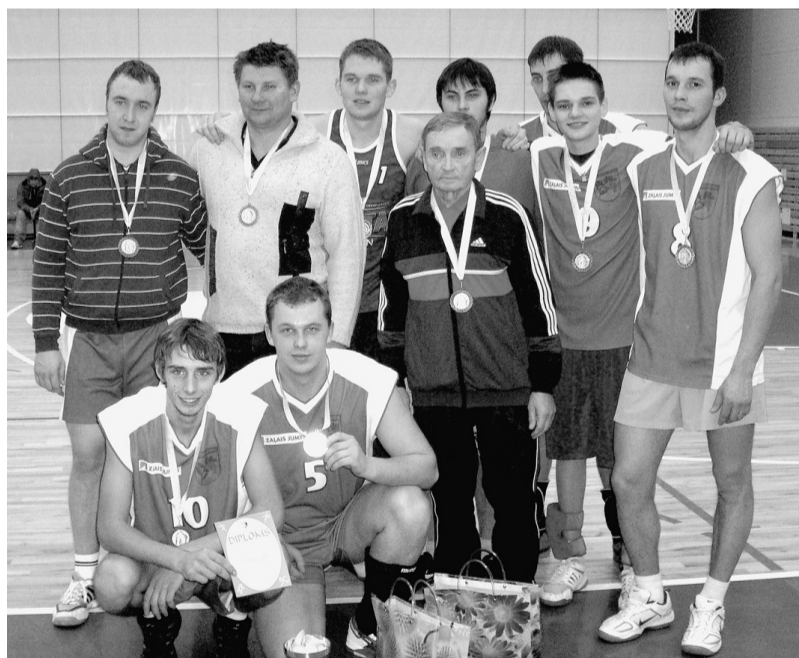
Ar sudraba medaļām.