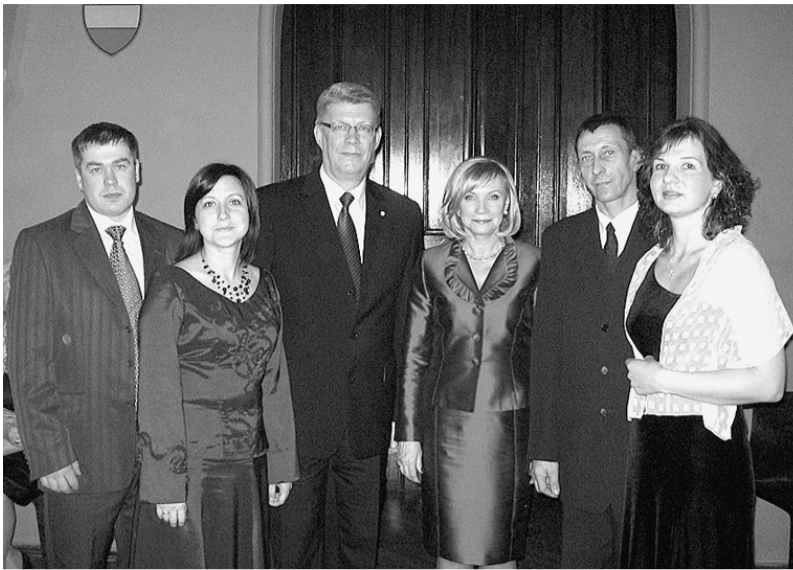
Kopā ar valsts prezidentu..

Oktobra sākumā mani negaidīti pārsteidza apsveikuma zvani, vēstules, ka ar žūrijas vienbalsīgu lēmumu ir noskaidrots pirmais konkursa „Mēs esam stipri” finālists. Tā ir biedrības „Mēs saviem bērniem” deju grupa „Mazais cilvēciņš” no Madonas novada, kas jau daudzus gadus kopā darbojas, palīdz cits citam un kopā atpūšas. Konkurssam pieteiktais projekts nosaukts „Darīsim visas lietas