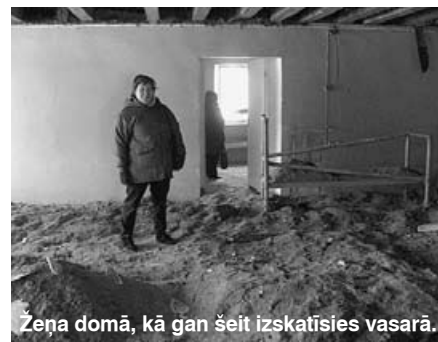
Žeņa domā, kā gan šeit izskatīsies vasarā.

tīkami, skaisti un mājīgi. Foajē telpu greznos skaistas kolonnas ar spoguļiem.