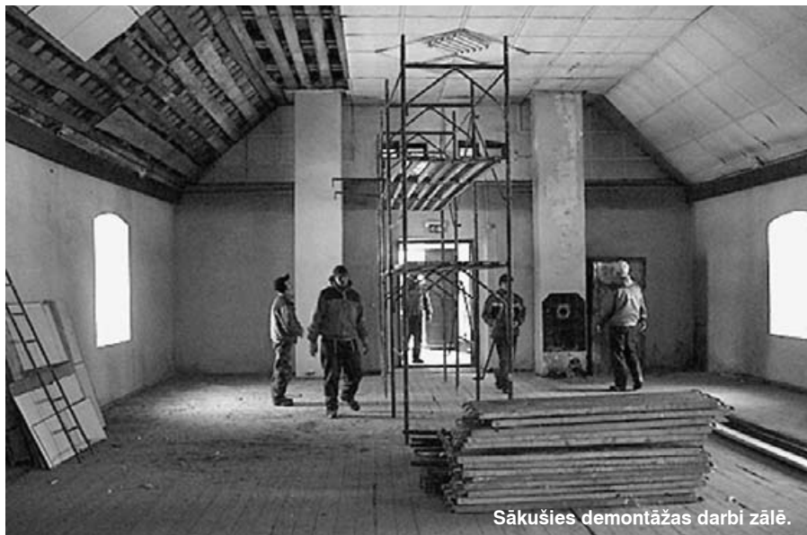
Sākušies demontāžas darbi zālē.