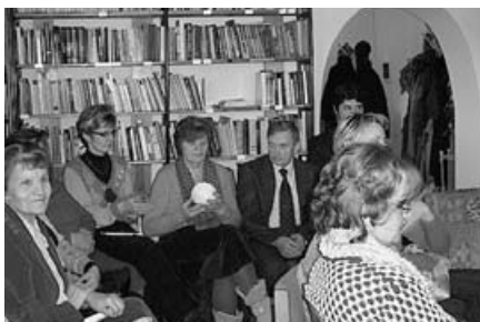
Svece no rokas rokā...

Un es pati būšu izplatījums, un sīkie putni tajā, nedz sienu, nedz ielu – visur drīkst. Lido drošāk, melno krauklī, balto balodīt.