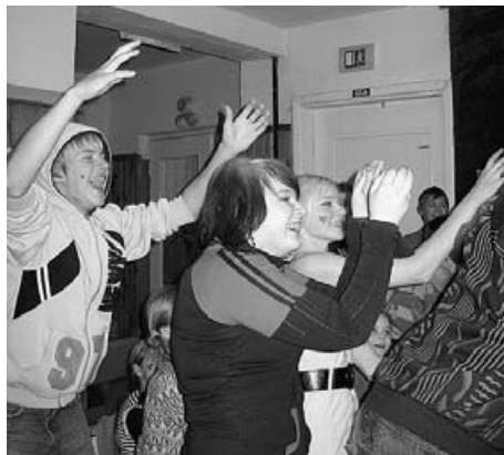
Pasākuma kulminācija – līgavas pušķa ķeršana.