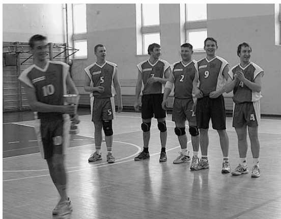
Komanda saņem uzvarētāju kausu.