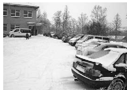
Sacensības pulcēja volejbolistus un fanus no malū malām...