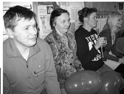
Skolotāji un vecāki skatītāju lomā...

Šis pasākums vienmēr paiet jautrā, brīvā atmosfērā.