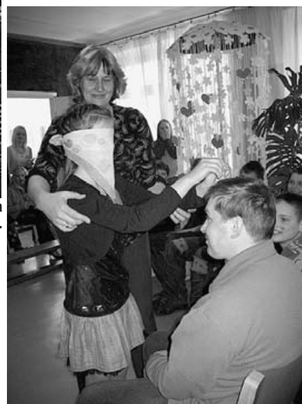
Pēc matiem jāatpazīst savs puisis.