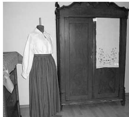
Vilmas Pastares šūdinātā blūze.