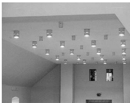
Griestiem jaunas, skaistas lampas.