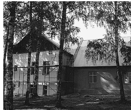
Tautas nams būs skaists arī no birzītes puses.