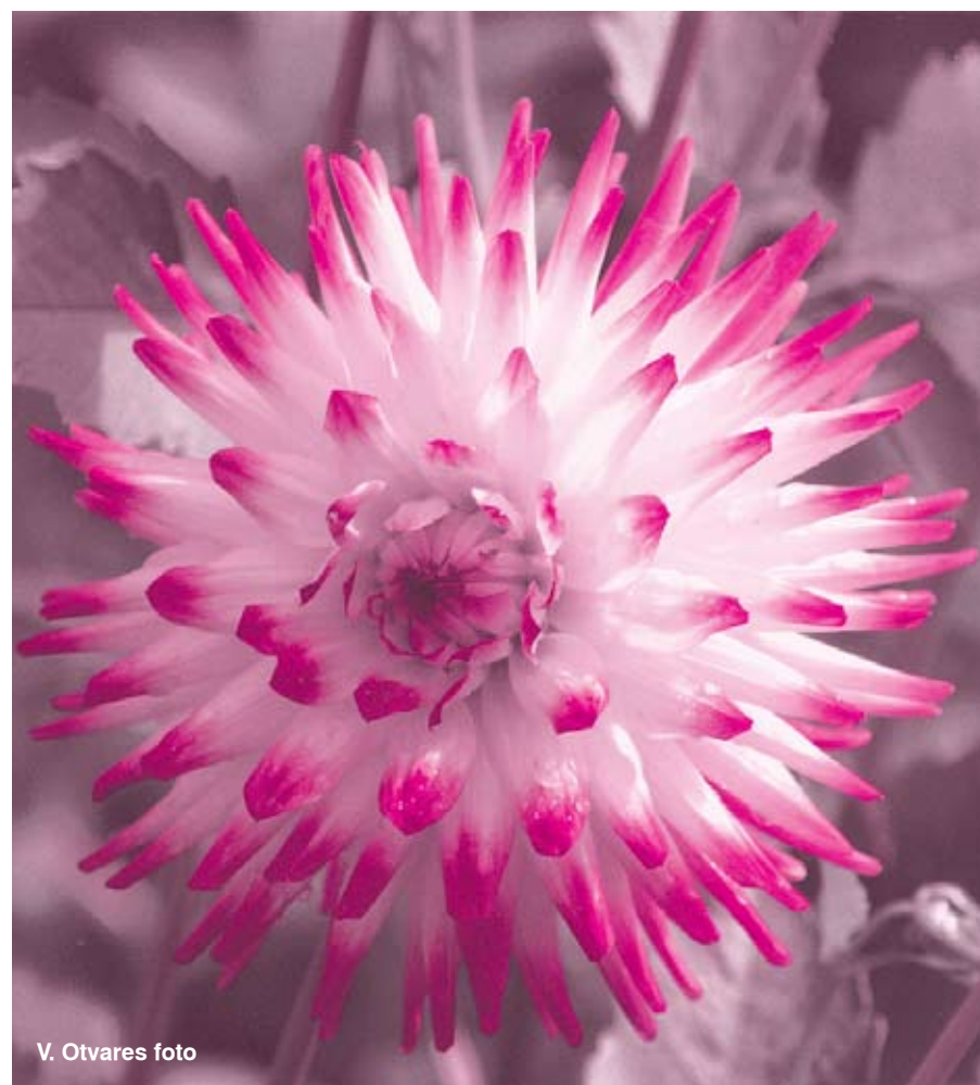
V. Otvares foto