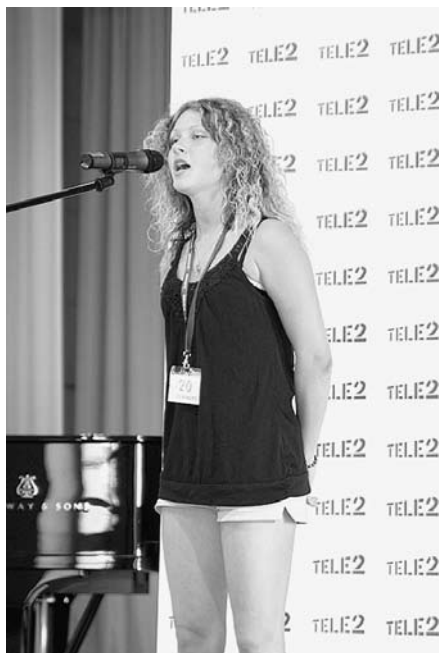
Lolita šova dalībnieku atlasē.

Bija manāms meiteņu pārsvars. Daudz bija tādu konkursantu, kas netika Jelgavas un Rīgas koros, brauca laimi meklēt uz Madonu. Pirms atlases visiem dalībniekiem vajadzēja aizpildīt anketas, kāpēc vēlos piedalīties šinī šovā. Es atbildēju, ka vēlos pārstāvēt Madonu, godam nest savas pilsētas vārdu tālāk,