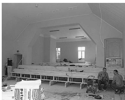
Top jauni podesti...