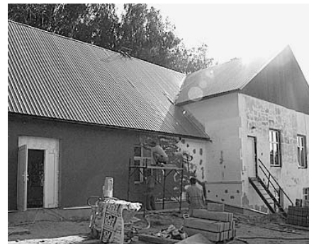
Strādnieki strādā pat brīvdienās.