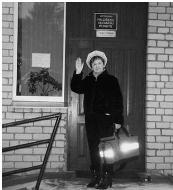
Ceļā pie kārtējā pacienta.

Tu atcerējies pirmos darba gadus. Kāda Tev bija pirmā tikšanās ar Mētrienu un tās cilvēkiem?