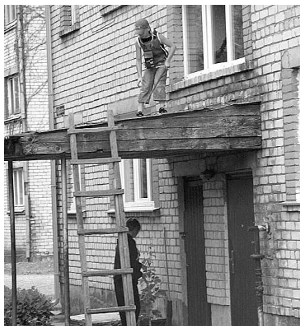
Tiek nojauktas vecās nojumītes.