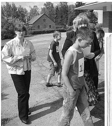
Dodamies uz krosu!