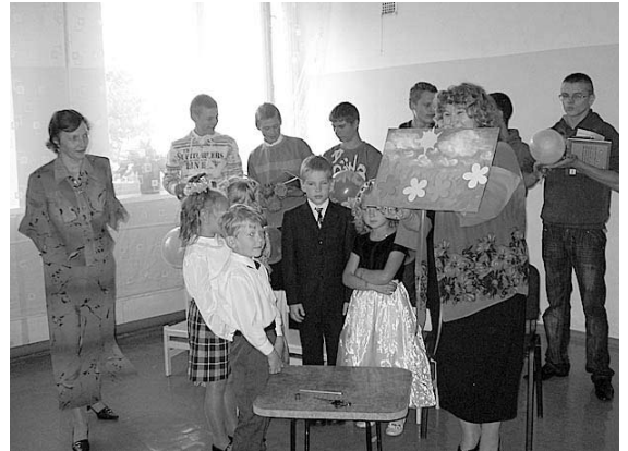
Mēs – puķītes, skolotāja – saulīte, kas sildīs.