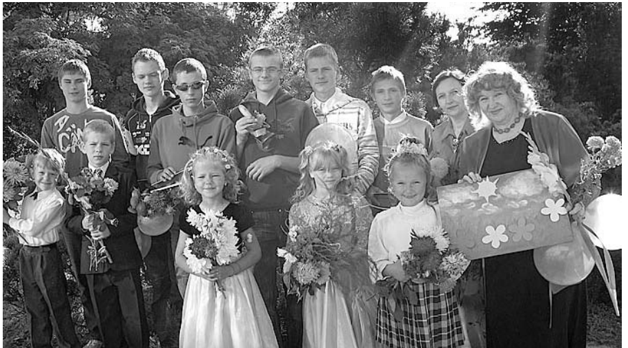
Pēc svinīgās līnijas.