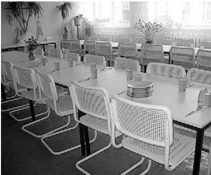
Skolas ēdamzālē jauni galdīti un krēslīti.