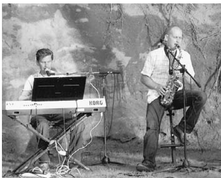
Mūziķi spēlē dalībnieku atpūtai.