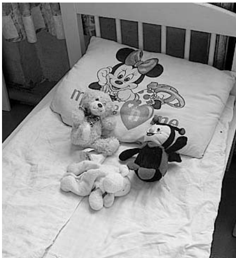
Kamēr bērņi mācās un rotaļājas, gultiņās aizmiguši viņu draudziņi...