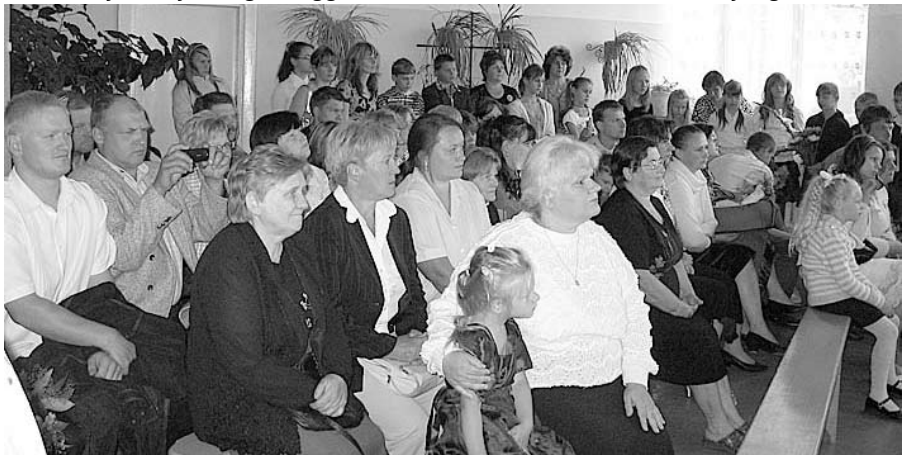
1. septembris nozīmīgs arī vecākiem.