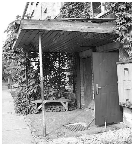
Laika zoba pieskāriens.