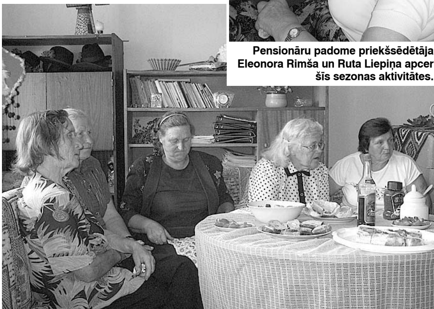
Vecākās paaudzes pašdarbnieces.