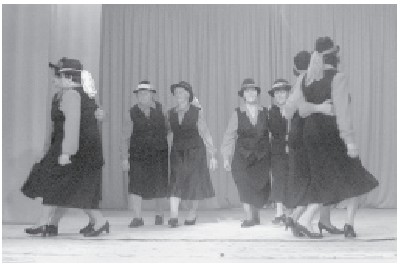
Uzstājas pašmāju pašdarbnieces.