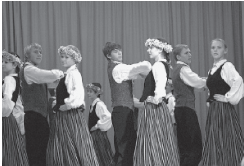
Dejo Kalsnavas jaunieši.