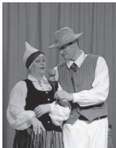
Atraktīvie Kalsnavas deļotāji.