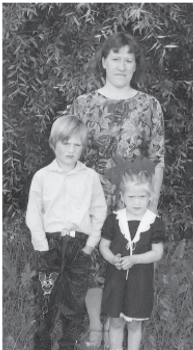
Mēs vēl mazi...

Mēs vēlam Tev stipru veselību, lielu izturību un daudz prieka un