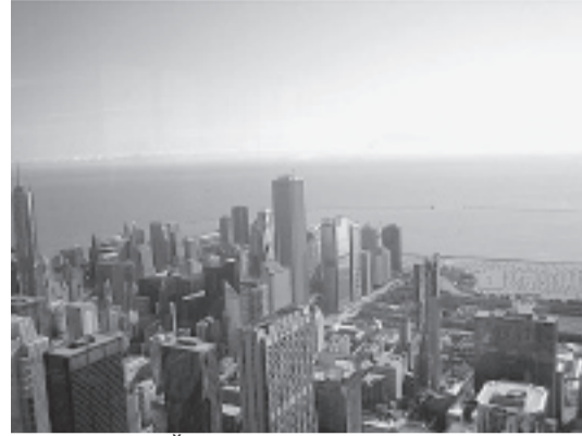
Čikāgas panorāma no 103. stāva.

Amerika tiešām ir tāda, kā rāda filmās. Pilsētā, kurā es biju, dzīvo apmēram seši tūkstoši iedzīvotāju. Vasarā to skaits pieaug līdz vairākiem miljoniem. Pilsēta ir kā liels atrakciju parks, kur atvaļinājumā dodas daudzas amerikāņu ģimenes un tūristi. Amerikā autovadītāja tiesības drīkst kārtot jau no sešpadsmit gadu vecuma, tāpēc nav brīnums, ka maza "knariņš" vada liela izmēra auto. Mašīnas tiešām ir milzīgas un daudz. Daudzi pārvietojas arī ar motocikliem, arī tetovējumi ir ierasta lieta. Realitāte ir arī filmās rādītie dzeltenie skolnieku autobusi. Skolas autobusu pārējie ceļu satiksmes dalībnieki apdzīt drīkst tikai pēc noteikta autobusa signāla, tāds ir likums. Ja to neievēro, ir lielas nepatīkšanas.