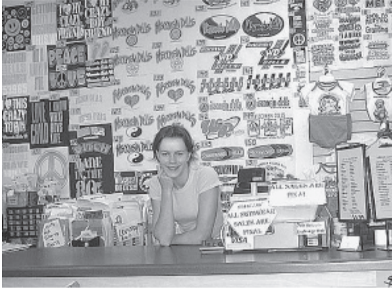
Darba vietā veikalā.

Cilvēkiem darbā ir augsta kultūra. Viss izdomāts līdz pēdējam sīkumam klientu ērtībām. Izbrīnu izraisīja autobusu šoferu darba pienākumi.