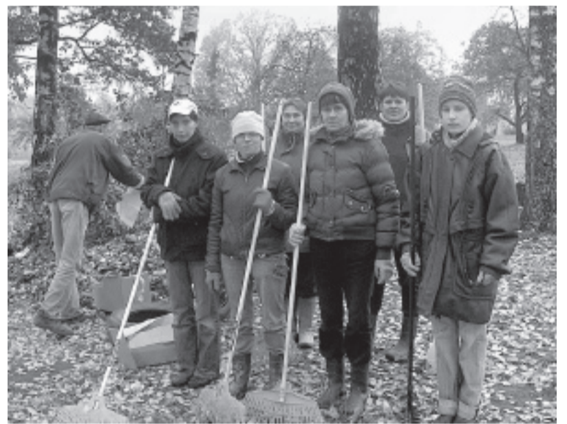
Nu gluži kā skolas laikos – darbam gatavi!

šanas. Katrs pasākumā iesaistītais bezdarbnieks tiek apdrošināts pret nelaimes gadījumiem darba praktizēšanas vietā. Bezdarbnieka kopējais dalības ilgums pasākumā nevar pārsniegt 6 mēnešus gada laikā.