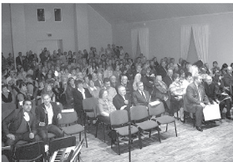
Pilna zāle skatītāju.