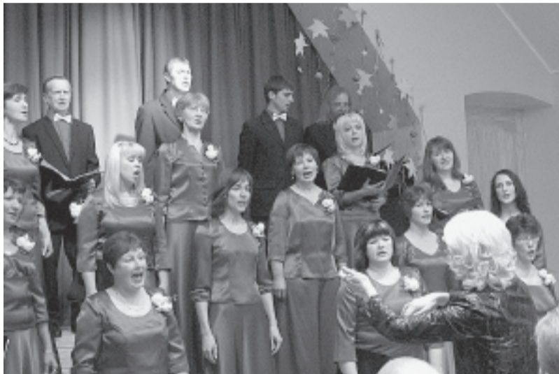
Koris „Lai top!”