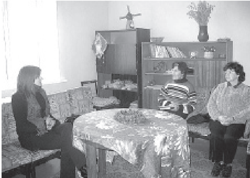
Tikšanās reizē ar pensionāru padomes dalībniecēm.

Ir grūti tā pateikt, cik ir saņēmuši tie, kuriem pienākas. Ir tādi cilvēki, kuri paši cīnās ar savām rokām un kājām un principa pēc, un kaut kāda kauna pēc vienkārši nenāk un neko nelūdz. Pati vēl esmu tikai dalījusi pārtiku un piešķirusi šo statusu, naudas ziņā esmu skopa, jo atkal atkārtos – līdz gada beigām ir jāiztiek ar ļoti minimālu naudas summu. Bet, skatoties cilvēku lietas, uzskatu, ka palīdzēti ir daudz, daudziem ir sagādāta malka, piešķirti šie GMI, atmaksāti medicīnas izdevumi, palīdzēti ar transportu, uzskatu, ka palīdzība ir pietiekoši