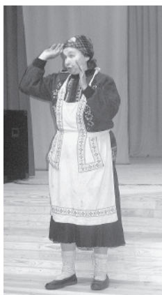
Saikavas dramatiskā kolektīva sveiciens.