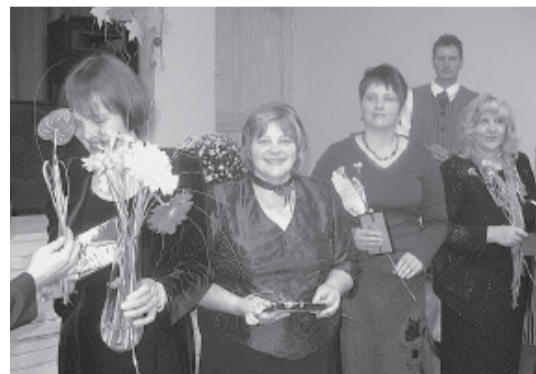
Paldies bijušajiem tautas nama vadītājiem un pulciņu vadītājiem.