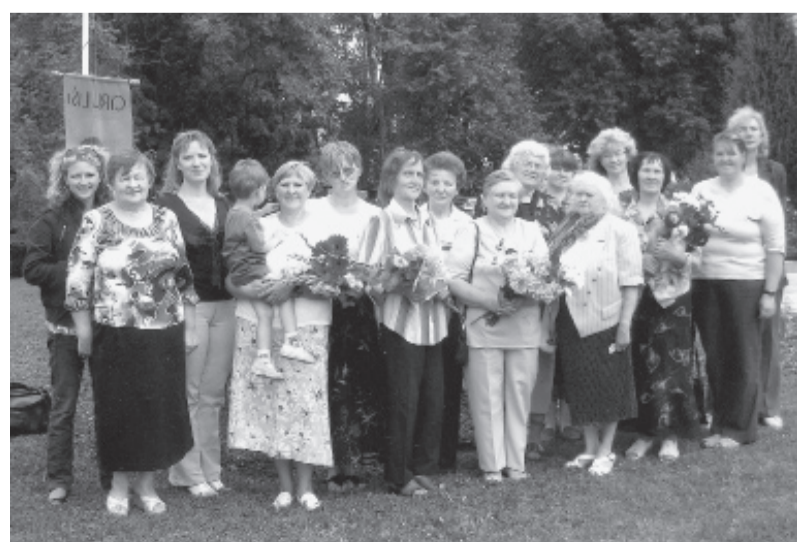
Bijušie kolēģi kopā.