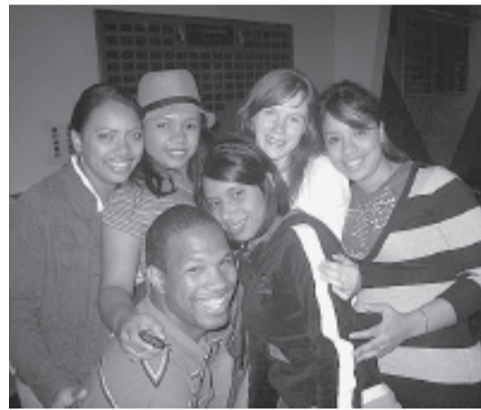
Ar draugiem no Dominikānas republikas.

Kādu laiciņu pavadīju Medisonā, kas ir Viskonsinas štata galvaspilsēta. Biju kopā ar meiteni, kura tikko uzsākusi studijas universitātē. Līdz ar to pati savām acīm redzēju arī to, ko rāda filmās par amerikāņu jauniešu ikdienā. Piemēram, mājas ballītes. Jaunieši klubos nav sastopami, jo alkoholu atļauts lietot tikai no divdesmit viena gada vecuma. Bet tas nenozīmē, ka nenotiek ballītes. Viss notiek privāti. Neiztiek arī bez policijas iejaukšanās. Tad visi bēg kur nu kurais.