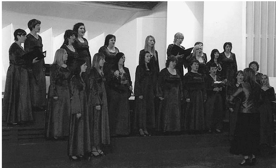
„Jūsma” dzied konkursā.