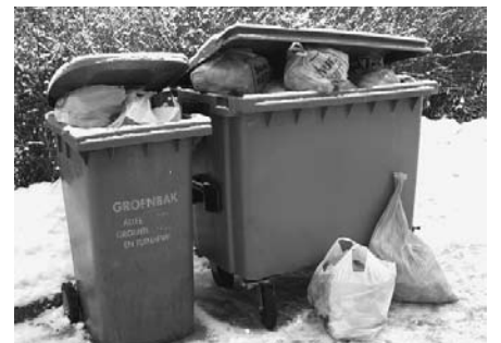
Šos maisiņus kāds pie Zilēm bija atstājis sestdienas rītā. Kur vēl ceturtdiena, kad tie tiks aizvesti...

Pagājušajā gadā vienā mēnesī par atkritumu izvešanu bija jāmaksā vidēji Ls 700.