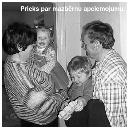
Prieks par mazbērnu apciemojumu.