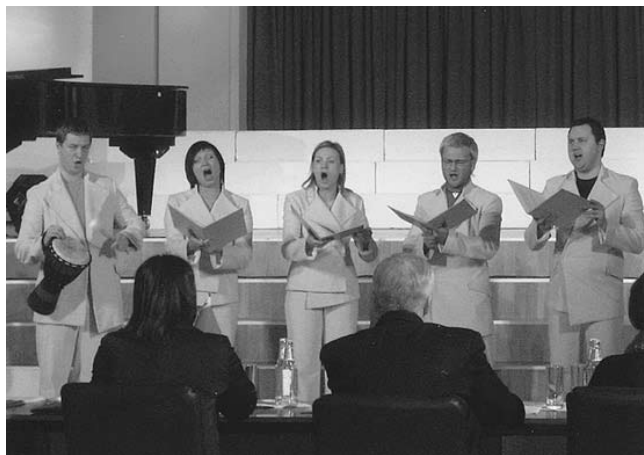
“Grand-Prix” ieguvējs – ansamblis “Teria”.