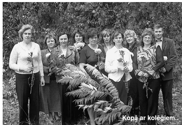
Kopā ar kolēģiem.