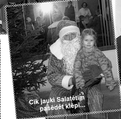
Cik jauki Salatētim pasēdēt klēpi...