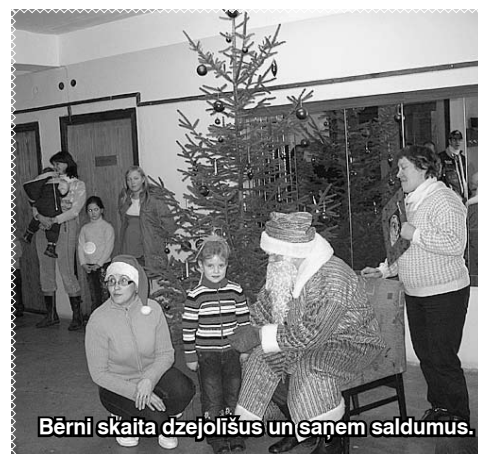
Bērni skaita dzejoļi un saņem saldumus.