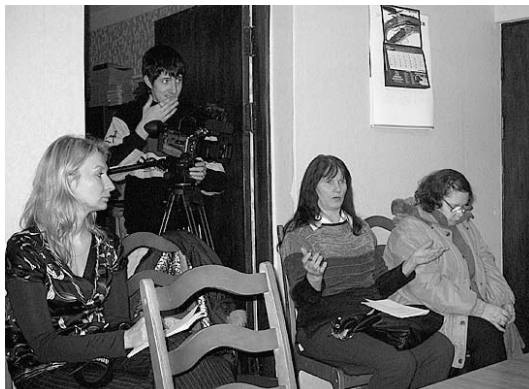
Uzdotos jautājumus piefiksēja žurnālisti no Vidzemes televīzijas... Turpinājums 4. lpp.