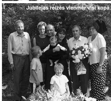
Jubilejas reizēs vienmēr visi kopā.