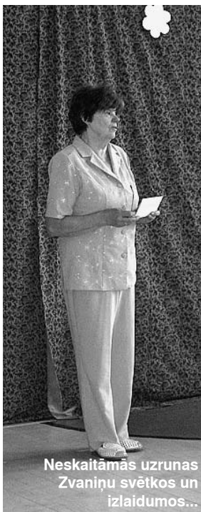
Neskaitāmās uzrunas Zvaniņu svētkos un izlaidumos...