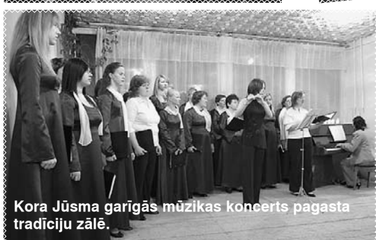
Kora Jūsma garīgās mūzikas koncerts pagasta tradīciju zālē.