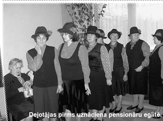
Dejotājas pirms uznāciena pensionāru eglīte.