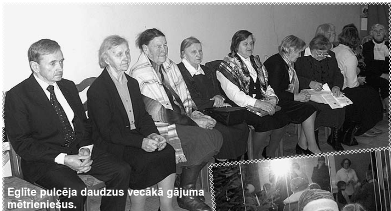
Eglīte pulcēja daudzus vecākā gājuma mētrieniešus.