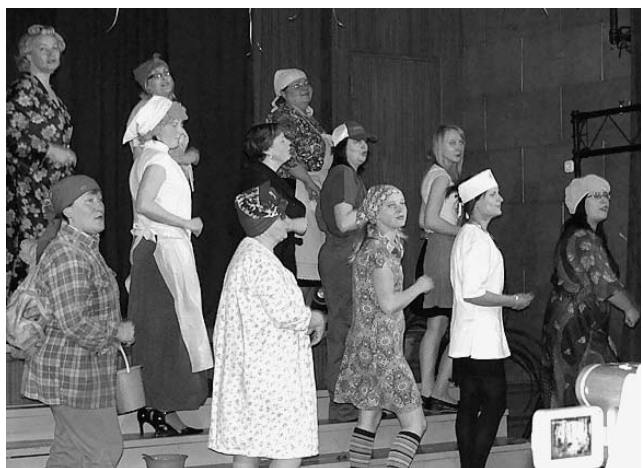
Sievietes, darbs un darbarīks...