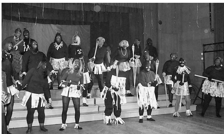
Viesi no Āfrikas Daugavpili neieradās, bet Ļaudonā gan bija klāt...

Mijas dziesmas, dejas, tēli un tērpi... Pie sestās kora „Jūsma” pārģērbšanās reizes mums ar Ļaudonas kultūras nama vadītāju krietni vien nākas izlocīt mēles gan dialogos, gan monologos, jo šajā brīdī meitenēm jāpārtop nēģerietēs un tas nevedas nemaz tik ātri. Bet, kas lēni nāk, tas labi nāk! Nez' vai publika vispār klausās dziesmā, drīzāk jau tomēr ir pārņēmta ar nēģeru tēlu pētīšanu. ©