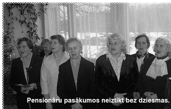
Pensionāru pasākumos neiztikt bez dziesmas.