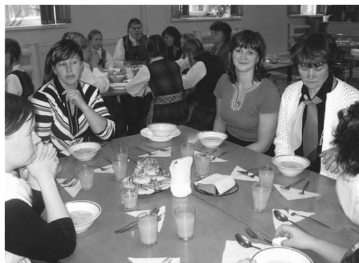
Pie pusdienu galda.

Pulkstenis jau rādīja deviņus vakarā, kad pārrādāmos „mājās” – Daugavpils 5. pamatskolā, un devāmies vakariņot. Skolas ēdnīcā mūs sagaidīja īstas mežcirtēju porcijas! Un, lai arī apzinājāmies, ka varbūt uz nakti nevarējām būt tik garšīgi, viss bija tik garšīgs, tik garšīgs, ka gudrības par „vakariņu atdošanu ienaidniekam” aizmirsās. (Ar pateicību šeit jāpiemetina, ka pavārites šādi mūs lutināja visu Daugavpilī pavadīto laiku!) Pēc vakariņām vēl sarīkojām mēģinājumu, lai izdziedātu rītdienas konkursa programmu. Skanēja skaisti, brīvi un nepiespiesti... Mēģinājumā izpratot, kā šīs labās sajūtas lai atsauc atmiņā rīt, stāvēt uz podestiem žūrijas komisijas priekšā.