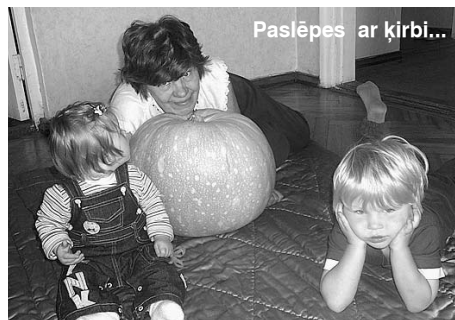
Paslēpes ar ķirbi...