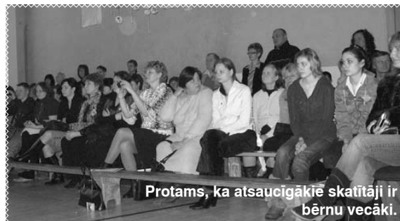
Protams, ka atsaucīgākie skatītāji ir bērnu vecāki.