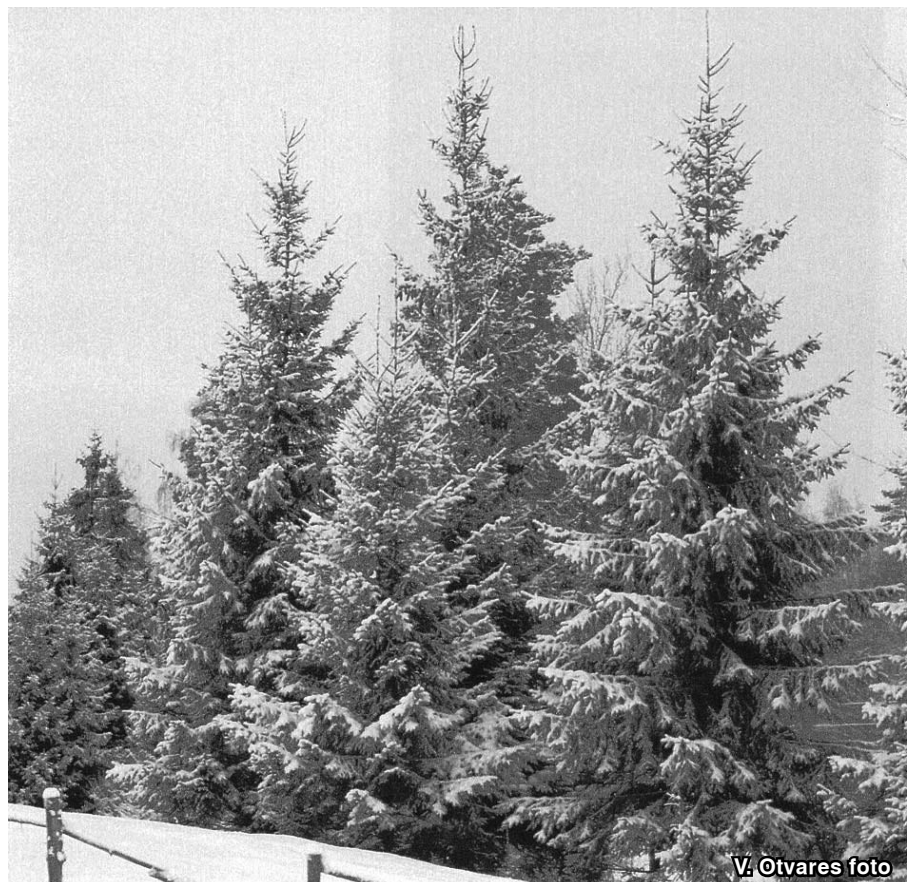
V. Otvares foto