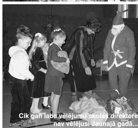
Cik gan laba vēlējumu skolas direktore nav vēlējusi Jaunajā gadā...