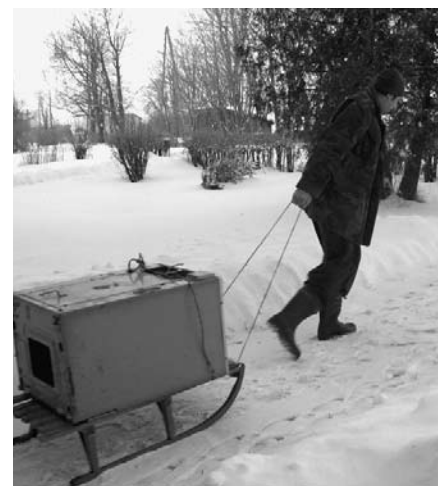
Nederīgās elektropreces tiek nogādātas uz savākšanas vietu...