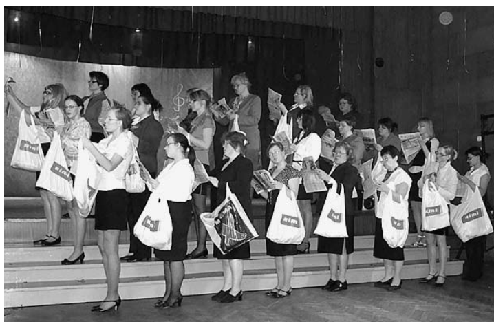
Man maisiņā ir austiņa...