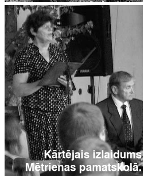
Kārtējais izlaidums Mētrienas pamatskolā.