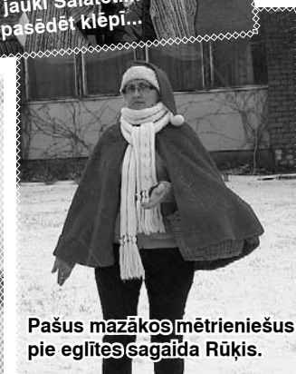
Pašus mazākos mētrieniešus pie eglītes sagaida Rūķis.