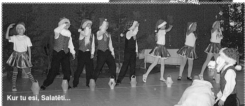
Kur tu esi, Salatēti...