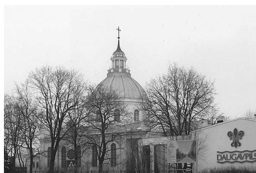
Daugavpilī. Turpinājums 8. lpp.