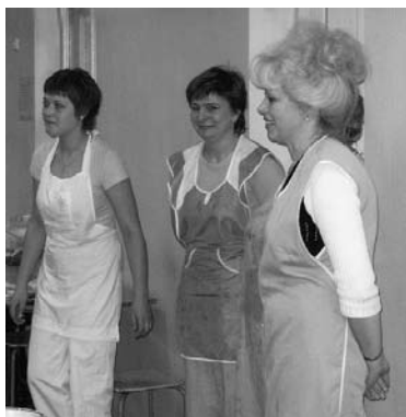
Par mums rūpējās šīs saimnieces.