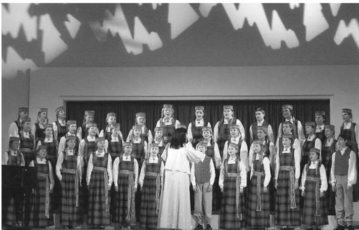
Uzstājas Lielvārdes bērnu koris.