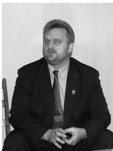
A. Ceļapīters domā, ka būs labi...

“Diemžēl vēlēšanu likumā tāda sistēma nav iestrādāta. Visi izvirzītie deputāti ir “vienā maisā”. Deputātu kandidātus izvirza partijas. Jābalso būs par sarakstiem. Tādas garantijas, ka noteikti tiks iebalsots savs cilvēks, nebūs. Būs 17 deputāti. Pagasta pārvaldes vadītājam, kas tiks iecelts, būs tiesības tieši virzīt jautājumus izskatīšanai novada domē nevis uz komitejām. Kopumā pagasta pārvalžu prob-