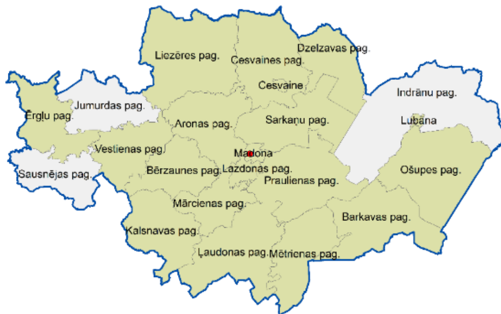
Attēls 6. Madonas pilsētas funkcionālās teritorijas.

104. Reģionālas nozīmes projektu idejas kuras sasaistē ar VPR vai kaimiņu pašvaldībām tiek plānotas realizēt termiņā līdz 2027. gadam ir iekļautas Madonas novada investīciju plānā.