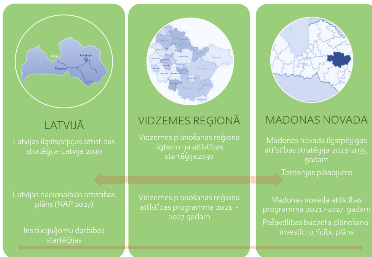
Attēls 4. Nacionālo, reģionālo un vietējo plānošanas dokumentu saskaņotība – ilgtermiņā, vidējā termiņā, īstermiņā.