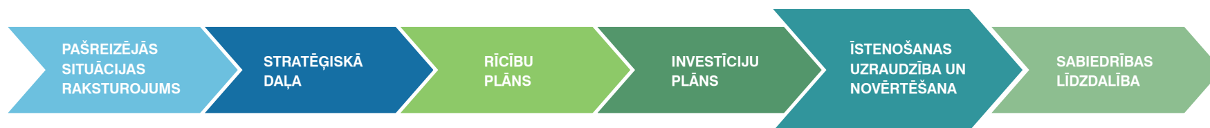
Attēls 7. Madonas novada ilgtspējīgas attīstības stratēģijas struktūra.