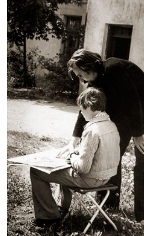
Plenērs. 1970. gadi. En plein air. 1970's.