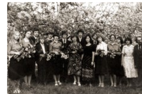
Madonas mākslas skolas pirmais izlaidums. 1979. gads. First graduation class of Madona Art School. 1979.