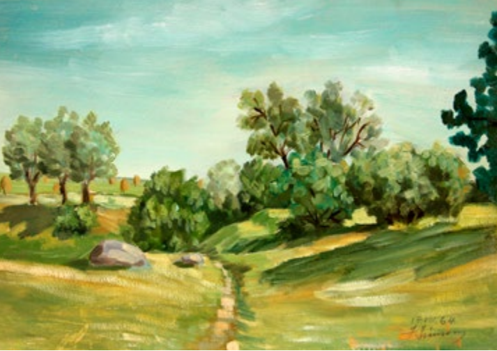
Vasaras saulē. 1963. Kartons, eļļa. 37,2 x 51 cm. Privātkolekcija. In the Summer Sun. 1963. Oil on cardboard. 37.2 x 51 cm. Private collection.