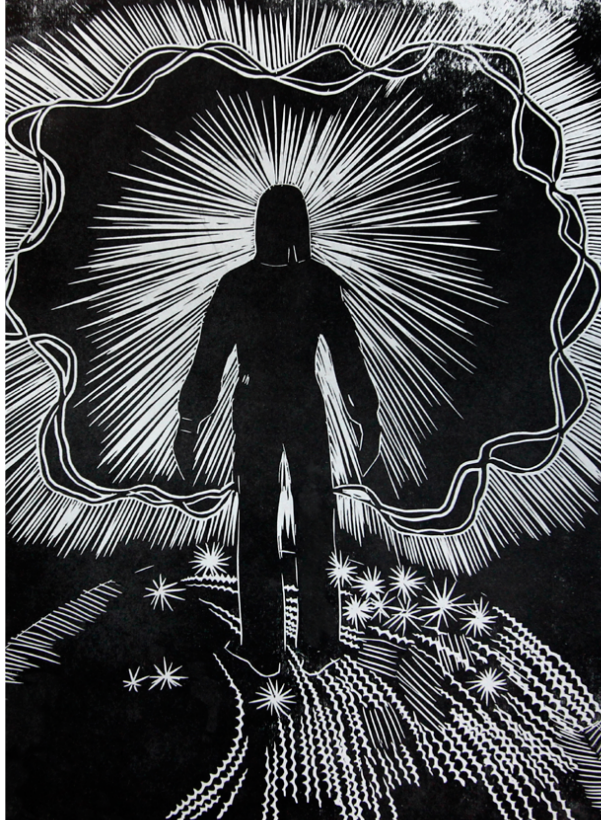
Bez nosaukuma. Papīrs, linogriezums. 53,2 x 37 cm. Privātkolekcija. Untitled. Linocut on paper. 53.2 x 37 cm. Private collection.