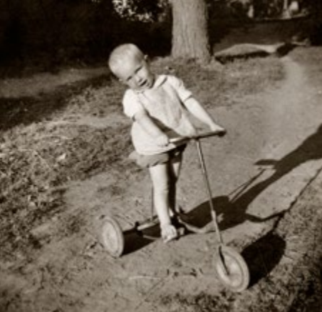
Bērniņa. 1950. gadi. Childhood. 1950's.