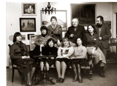
Madonas mākslinieku grupa. 1982. gads. The Madona artists' group. 1982.