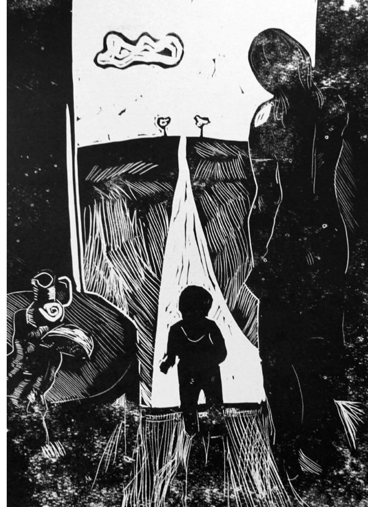
Bez nosaukuma. Papīrs, linogriezums. 41 x 32 cm. Privātkolekcija. Untitled. Linocut on paper. 41 x 32 cm. Private collection.