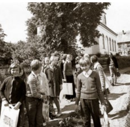
Plenērā. Madonas mākslas skola. 1970. gadi. En plein air. Madona Art School. 1970's.