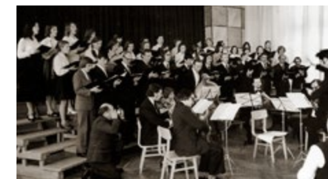
Apvienotais Madonas mākslas skolas un Madonas mūzikas skolas koris. 1970. gadi. Combined choir of Madona Art School and Madona Music School. 1970's.