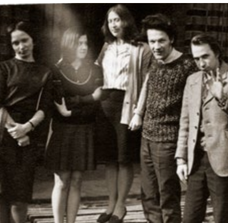
Ar kursabiedriem pie LMA. 1970. gadi. With classmates at LMA. 1970's.