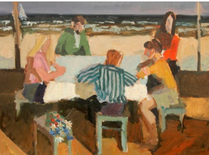
Bez nosaukuma. 1970. gadi. Audekls, eļļa. 66,5 x 85,3 cm. Privātkolekcija. Untitled. 1970's. Oil on canvas. 66.5 x 85.3 cm. Private collection.